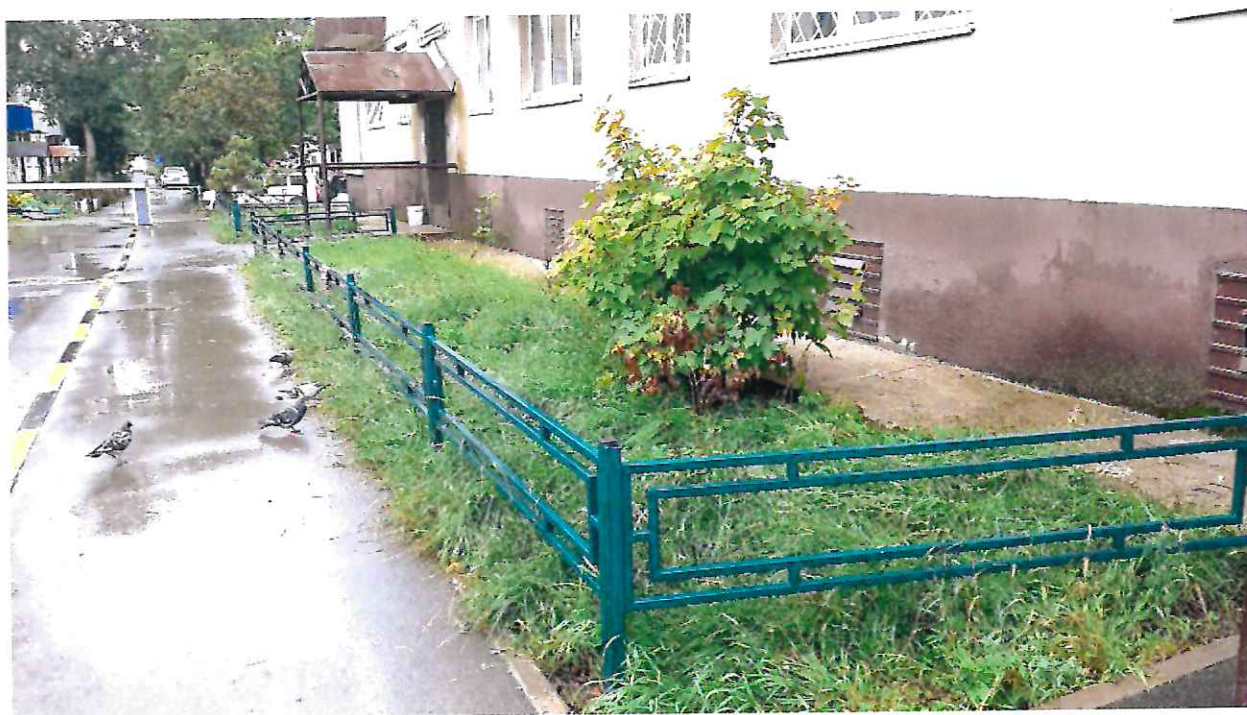
Реализация проекта ТОС «Дружные соседи»