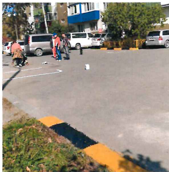
Реализация проекта ТОС «Горького-2»