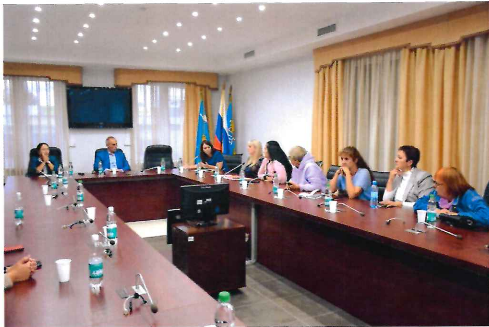
Встреча с жителями 4,7,8 микрорайонов города Южно-Сахалинска