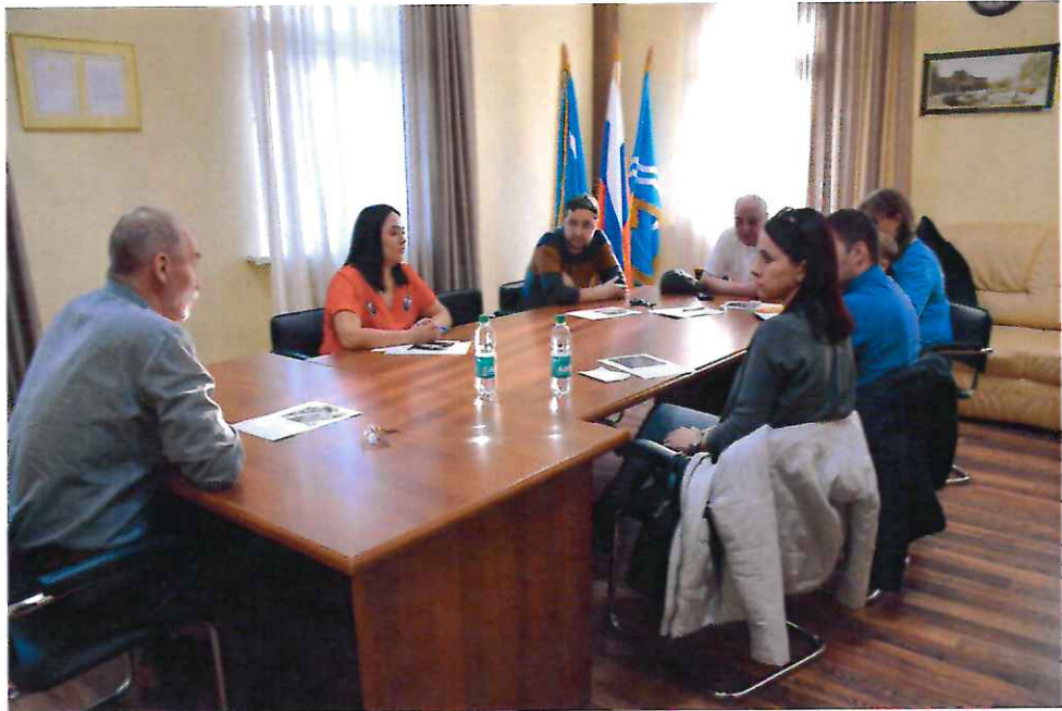
Встреча с жителями дома 10-А по улице Тихоокеанской