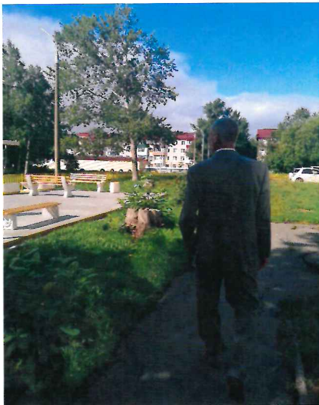
Реализация проекта ТОС «Ивушка» (Спортивный проезд, 13-А)