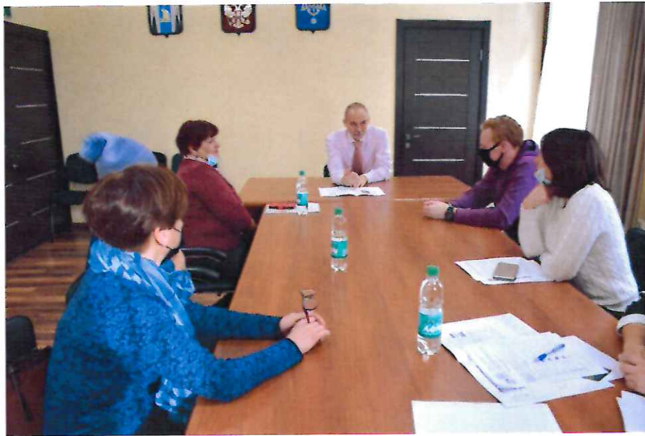
Встреча с жителями домов 5-7 по Спортивному проезду