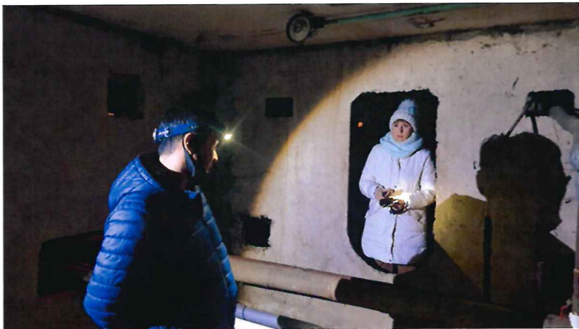
Обследуем подвальное помещение дома №288 по ул. Комсомольская

Среди обратившихся в 2021 году были и жители дома №288 по ул. Комсомольская с жалобой на неудовлетворительную работу системы горячего водоснабжения. Для решения проблемы встретилась со специалистами АО «Сахалинская Коммунальная Компания» и УК «ЖЭУ-9». Выехали на место для того, чтобы найти причину проблемы. В результате обследования многоквартирного дома выяснилось, что подвальное помещение уже много лет забито мусором, старой мебелью и т.п. И это после проверки подвалов МКД города, которая была инициирована губернатором. Но надо отдать должное специалистам УК «ЖЭУ-9» – оперативно исправили ситуацию и очистили повал.