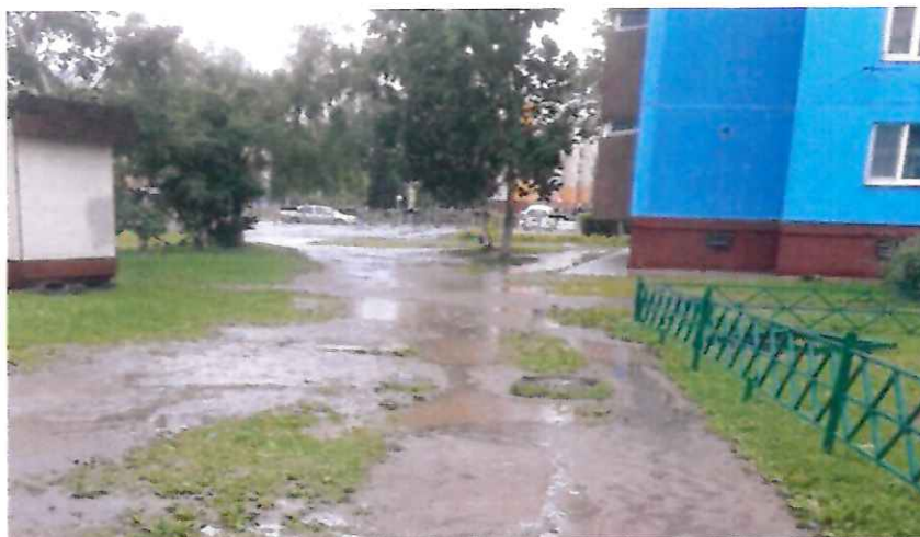
«Народная тропа» до благоустройства

сотрудников Завода имени М.А. Федотова, в 2021 году удалось добиться её благоустройства.