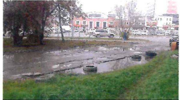
На фото прилегающая к дому №235 по пр. Мира территория до проведения благоустройства