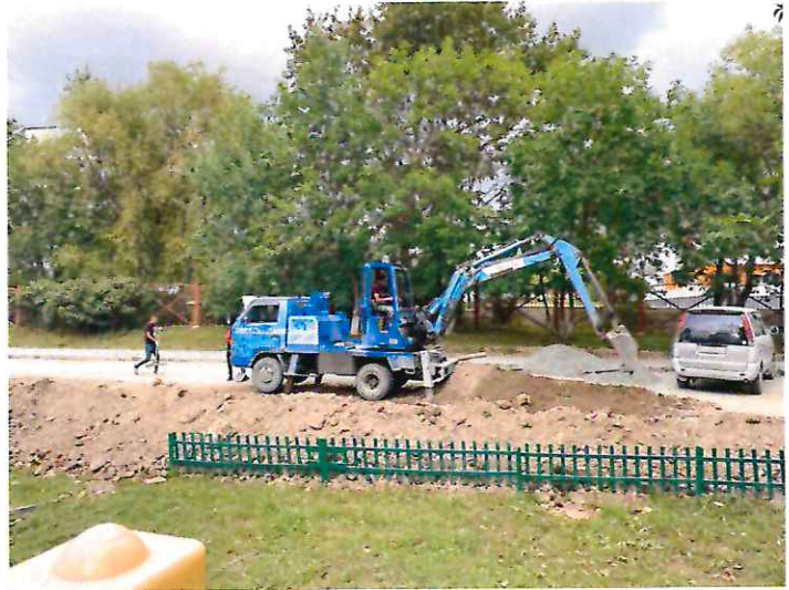
Процесс благоустройства территории возле начальной школы №21

В 2021 году, благодаря помощи мэрии, руководителя и специалистов Завода имени М.А. Федотова, благоустроили и территорию вокруг средней общеобразовательной школы №22.