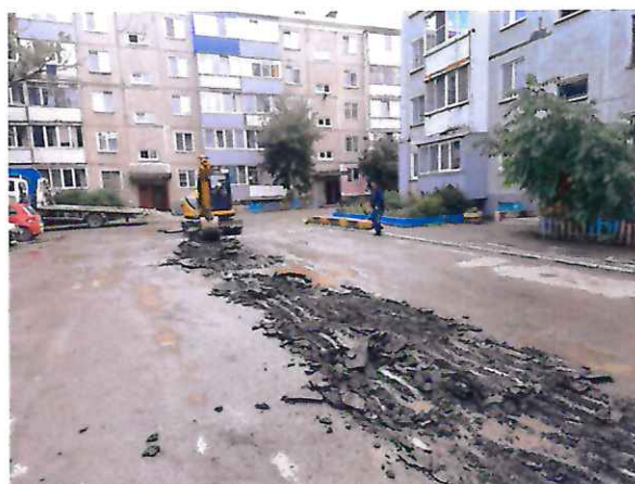
Ямочный ремонт на придомовой территории домов №80 и №82-А по ул. Пуркаева