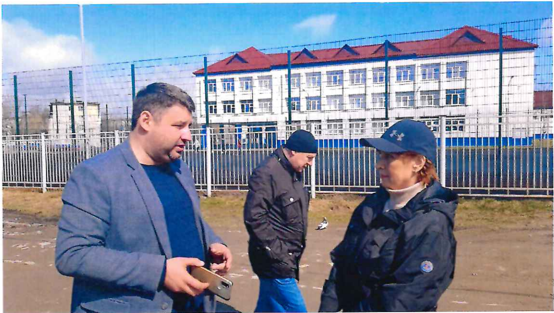
Обсуждаем с руководителем Завода имени М.А. Федотова будущее благоустройство территории вокруг школы №22

В 2021 году, благодаря помощи мэрии, руководителя и специалистов Завода имени М.А. Федотова, благоустроили и территорию вокруг средней общеобразовательной школы №22.