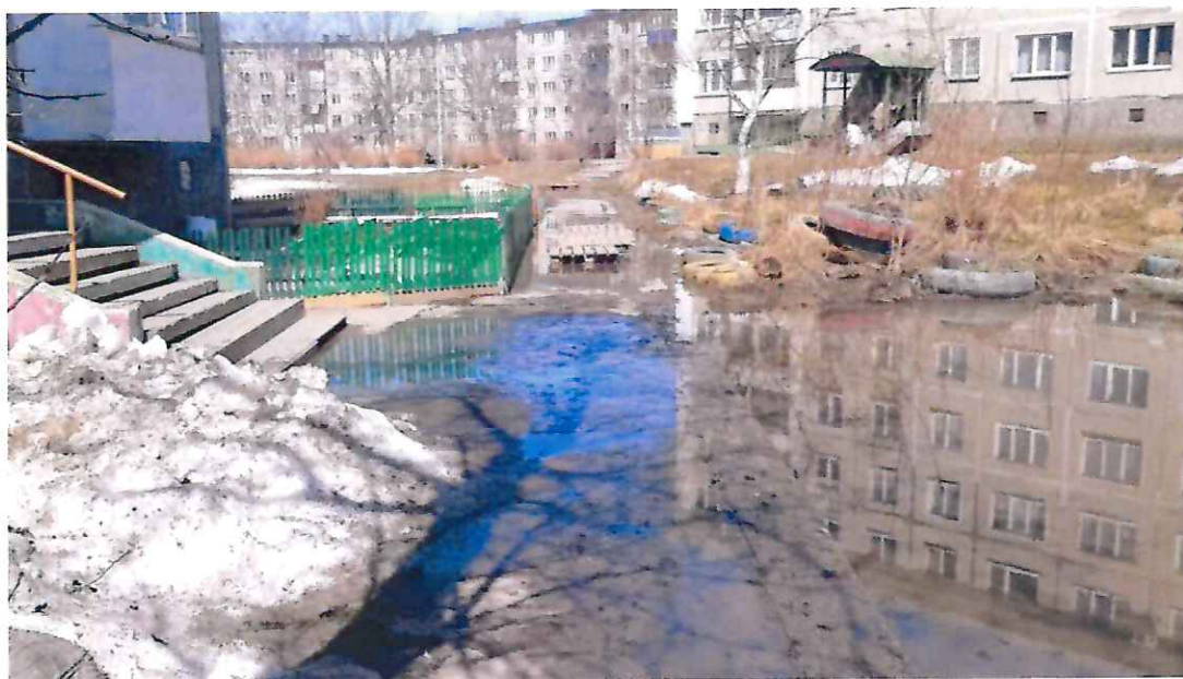
Дорога к социальному учреждению выстелена строительными конструкциями

Уже не первый год пытаюсь решить эту проблему – обращалась в мэрию Южно-Сахалинска, на сервис «Сахалин.онлайн». Обещали благоустроить в 2020 году, в 2021 году, но срок благоустройства регулярно отодвигается, хотя с жителями МКД и городскими чиновниками еще в 2019 году обсуждали проект благоустройства.