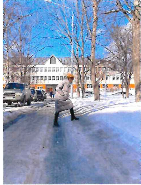
На фото аллея, ведущая к школе, до проведения благоустройства