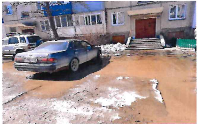
Придомовая территория многоквартирных домов 80, №82 и №82-А по ул. Пуркаева

Рядом, в доме №80 по ул. Пуркаева, размещено отделение «Центра социального обслуживания населения Сахалинской области». Ежедневно социальное учреждение посещают сотни жителей нашего города: семьи с детьми, пенсионеры, граждане с ограниченными возможностями. И они вынуждены преодолевать лужи и грязь при помощи деревянных строительных конструкций, что небезопасно для их здоровья.