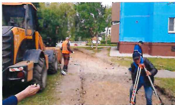
Процесс благоустройства «тропы»