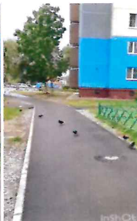
«Народная тропа» после благоустройства (что было и что стало)

В 2021 года на прилегающей к начальной общеобразовательной школе № 21 территории провели работы по благоустройству. Мало того, что почти 40 лет учащиеся школы (а их в настоящее время более 1300 человек) ходили в образовательное учреждение практически по проезжей части в отсутствии тротуаров, так еще и на