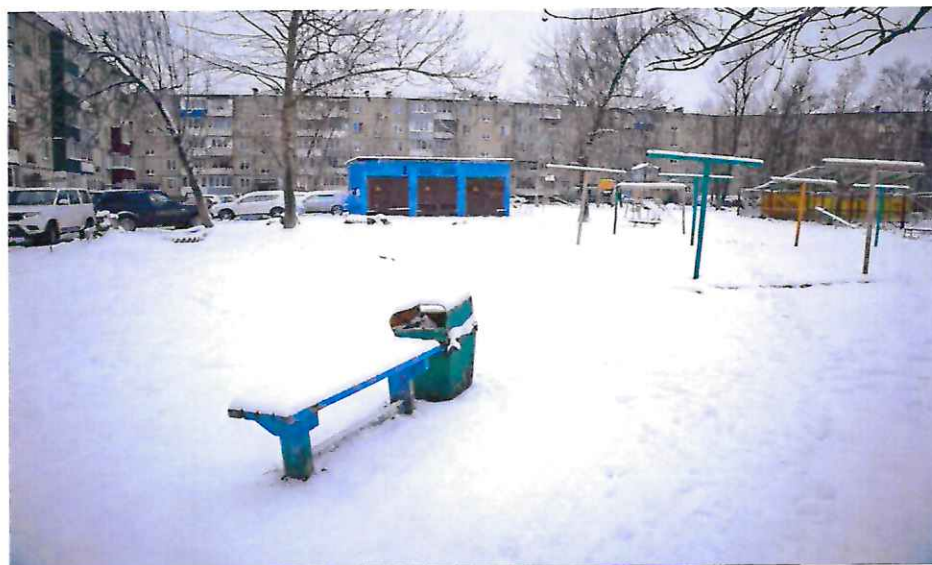
Двор дома №245-Б по пр. Мира

Аналогичное обращение было и от жителей дома №245-Б по пр. Мира – придомовая территория нуждается в благоустройстве: проезд требует замены твердого покрытия, необходимо обустроить парковочную зону, детскую площадку.