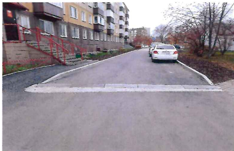
На фото западная сторона дома №235 по пр. Мира после благоустройства