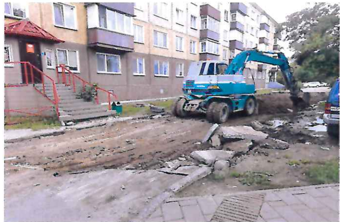
Процесс благоустройства территории