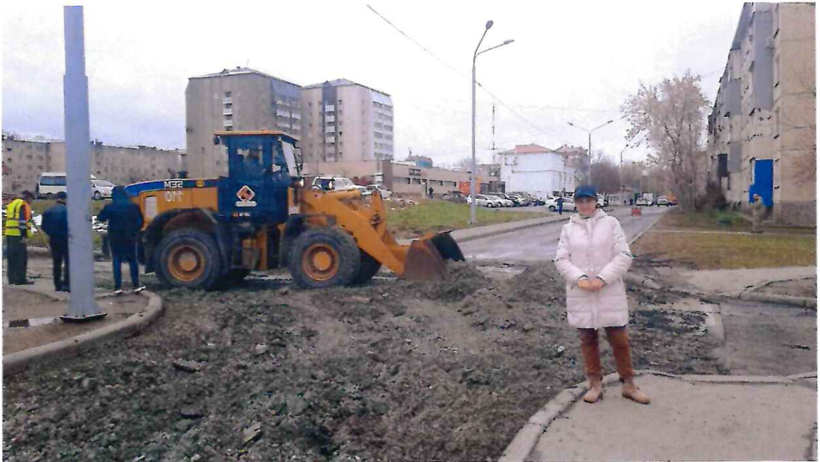
На фото работы на перекрестке с северной стороны школы №22

Помимо ремонта внутриквартальных проездов, совместно со специалистами Завода имени М.А.Федотова организовали и провели субботник на территории округа.