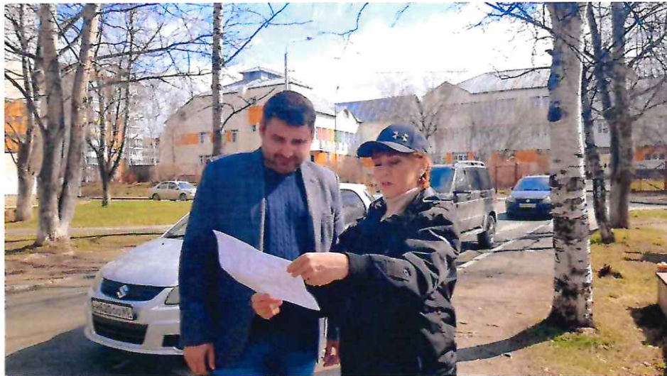
Обсуждаем с руководителем Завода имени М.А. Федотова проект благоустройства аллеи возле школы №21