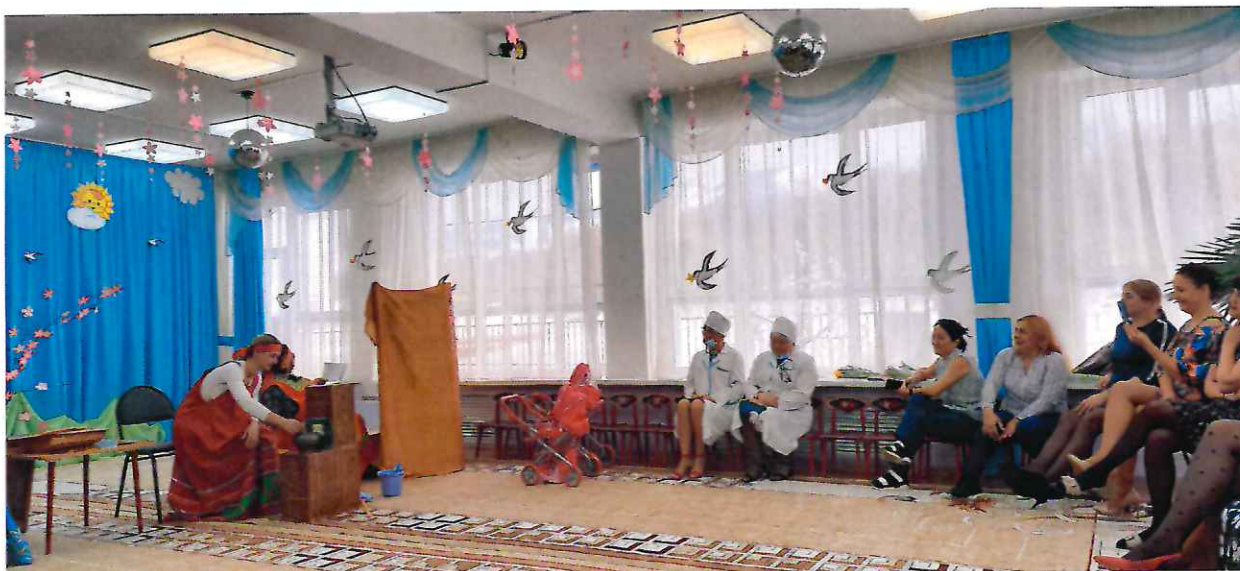
Праздничное мероприятие в детских садах «Жемчужина» и «Полянка», приуроченное к Международному женскому дню, на территории избирательного округа № 20.