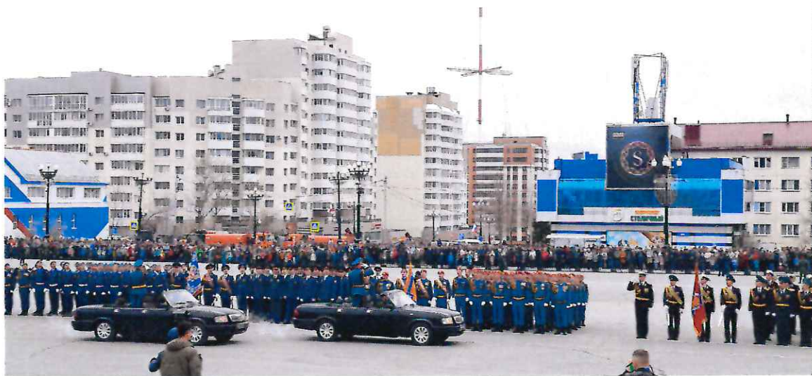
Парад в год 76-летия Победы в Великой Отечественной войне и возложение венков воинам на площади Славы.