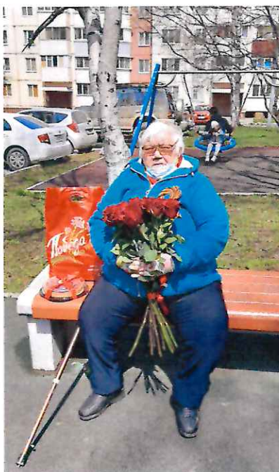
Поздравление ветеранов Великой Отечественной войны, участников трудового фронта и «детей войны» с Днём Победы.

Более подробно о деятельности депутата Городской Думы города Южно-Сахалинска можно узнать в социальных сетях: