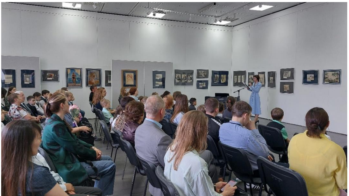
Подведение итогов конкурса творческих работ в преддверии Дня Победы