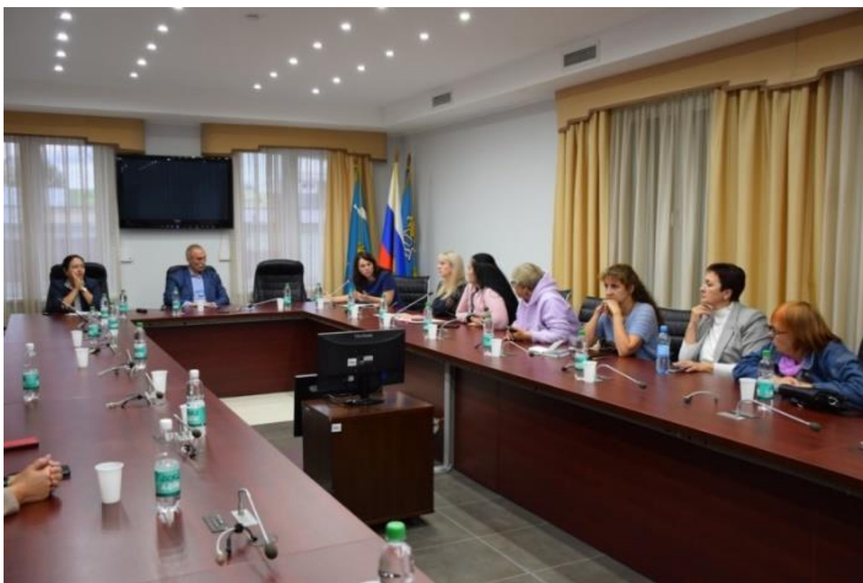
Встреча с активными жителями мкр «Черёмушки»