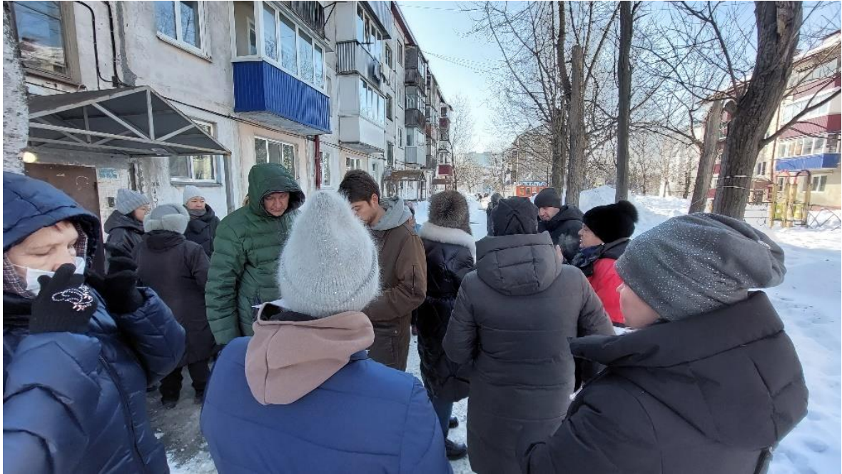
Рабочая встреча с жителями по Спортивному проезду, 9,11, 13

В 13 округе еще много дворов, которые нуждаются в ремонте - как в замене асфальтового покрытия, так и в установке новых современных детских игровых форм. Сегодня, к сожалению, отсутствует возможность включить в план капремонта несколько дворов сразу. Надеемся, что ситуация с финансированием в скором времени изменится, и появится возможность благоустраивать несколько дворов