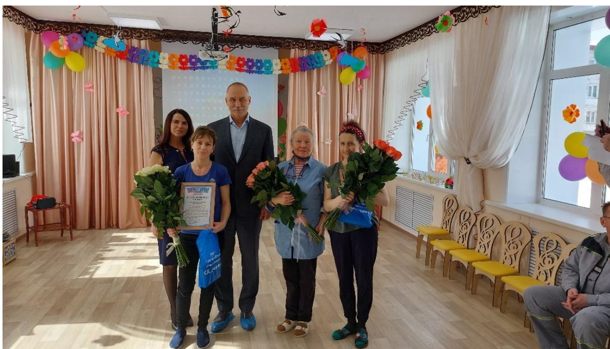
Поздравление коллектива детского сада № 43 «Светлячок» с 8 марта