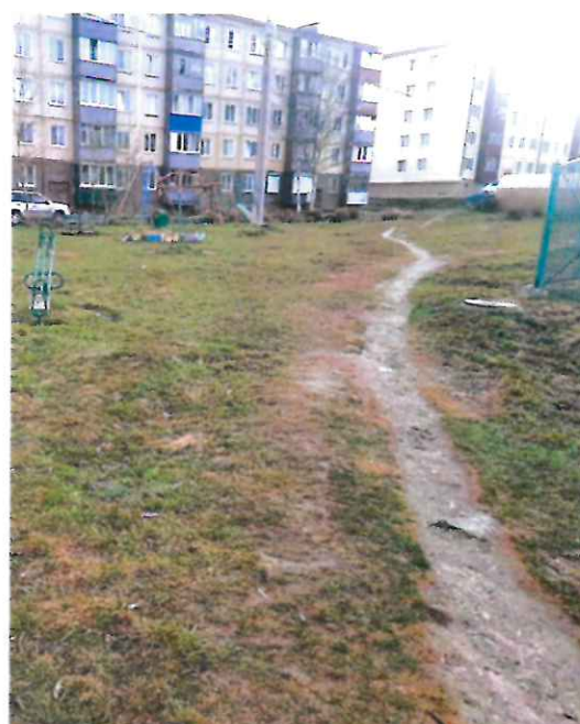
"Народная тропа" до благоустройства