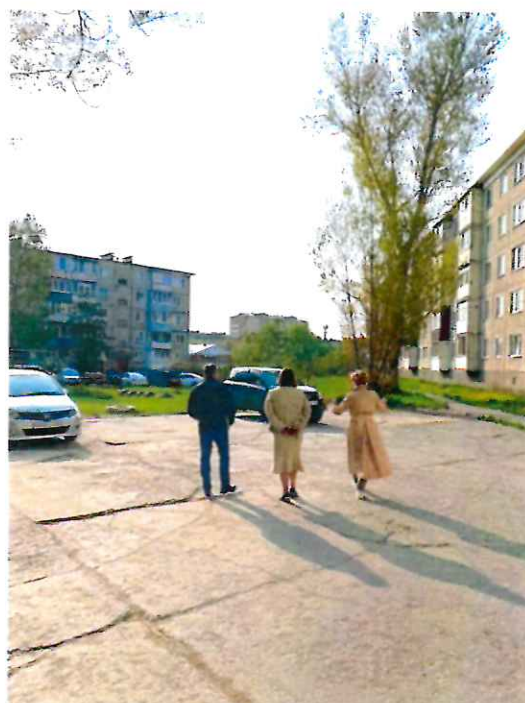
С министром ЖКХ Сахалинской области обсуждаем предстоящий капитальный ремонт двора

И, конечно же, вместе с жителями проводили встречи во дворах, где также обсуждали проекты, вносили предложения и замечания.