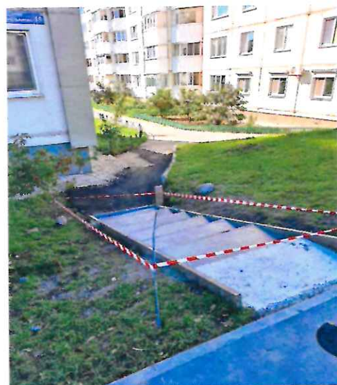
Спуск с ул. Комсомольская (до и после реконструкции улицы)

Проведено благоустройство заброшенного пустыря с западной стороны дошкольного учреждения №7 "Золушка".