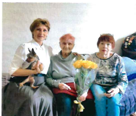
Встречи с ветеранами Великой Отечественной войны

Традиционно в честь Дня Победы, Дня окончания Второй мировой войны и освобождения Южного Сахалина и Курильских островов поздравляю ветеранов, проживающих, в том числе, на нашем избирательном округе, прихожу к ним в гости с подарками и теплыми словами.