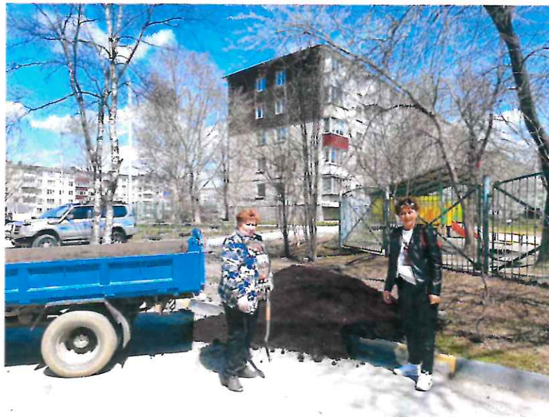
Благоустраиваем палисадник у дома №282 по ул. Комсомольской

Управляющая компания этот вопрос не решила. Поэтому я самостоятельно приобрела и завезла им плодородную землю для посадки цветов.