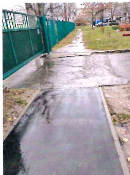
"Народная тропа" после благоустройства