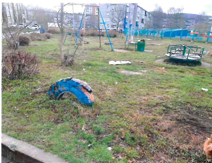
Неблагоустроенный двор в нашем округе

К сожалению, на нашем избирательном округе еще остаются неотремонтированными дворы (например, придомовая территория д.235, д.237, д.239-А, д.239-Б, д.239-В, д.241, д.241-А, д.243 по пр. Мира, д.21, д.23 по ул.Емельянова), реконструкция которых также требует значительных финансовых вложений.