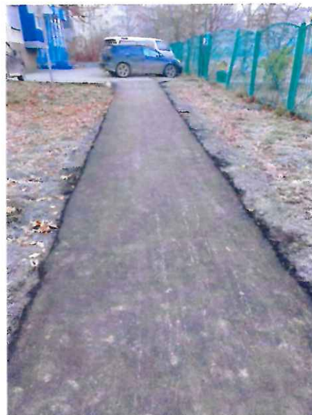
Обсуждаем устройство тротуара