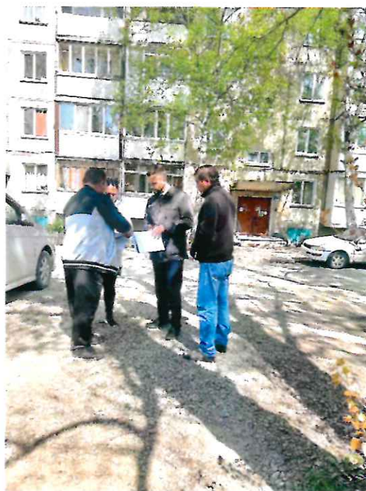
С представителями администрации города обсуждаем предстоящий капитальный ремонт двора по ул. Пуркаева, д.80, д.82, д.82-А