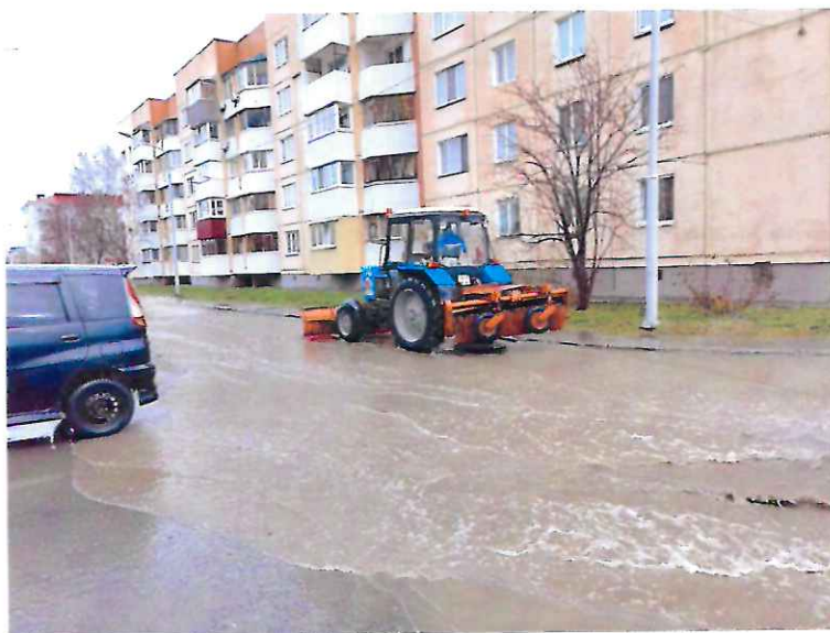
Внутриквартальный проезд в 9-ом микрорайоне после дождя

Кстати, проблема подтопления касается не только подвалов МКД, дворов нашего округа, но и внутриквартальных проездов.