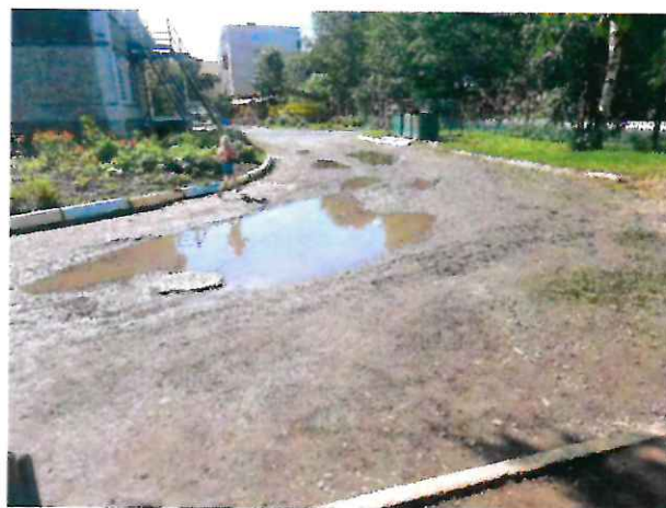
Территория дошкольного учреждения №1 "Загадка"

В 2022 году традиционно занималась проблемой вывоза снега со дворов. Циклоны на Сахалине не такие частые, но, к сожалению, многоснежные. И зачастую после циклона управляющие компании проводят расчистку проездов и тротуаров, складывая снежные массы на детские площадки и газоны во дворах.