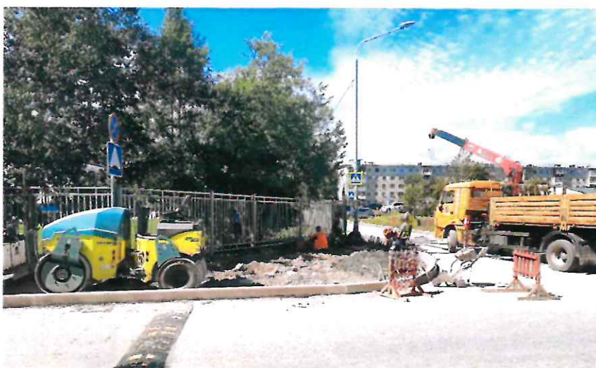
Устройство нового тротуара специалистами Завода имени М.А. Федотова

Кроме того, новый тротуар появился и между двумя общеобразовательными