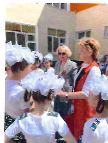
Конкурс-смотр строя и песни «Солдатушки- бравы ребята!» в школе №21

В рамках ежегодного отчета мэра Южно-Сахалинска в Городской Думе в 2022 году подготовила и направила 10 вопросов главе города. Среди моих вопросов к мэру были вопросы, касающиеся: