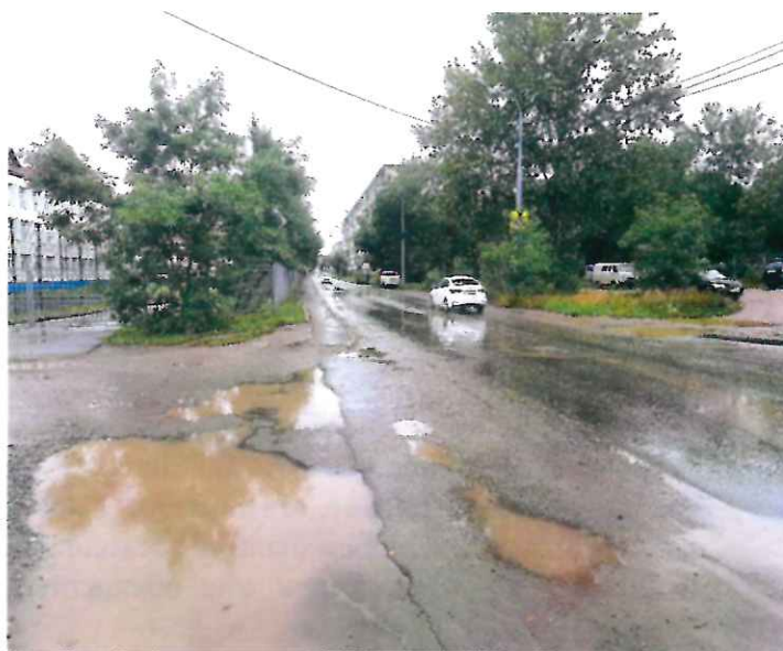
На фото - тротуар, ведущий к школе №22, до проведения благоустройства