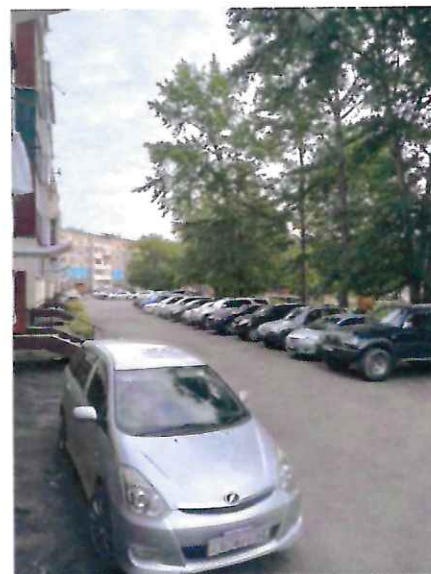
Прилегающая к дому №243 по пр. Мира территория до и после проведения благоустройства

Конечно, замена дорожного покрытия проездов не заменит полноценный капитальный ремонт дворов (обращений по данной проблеме больше всего), который так необходим нашему округу, поэтому этот вопрос находится на моем постоянном контроле.