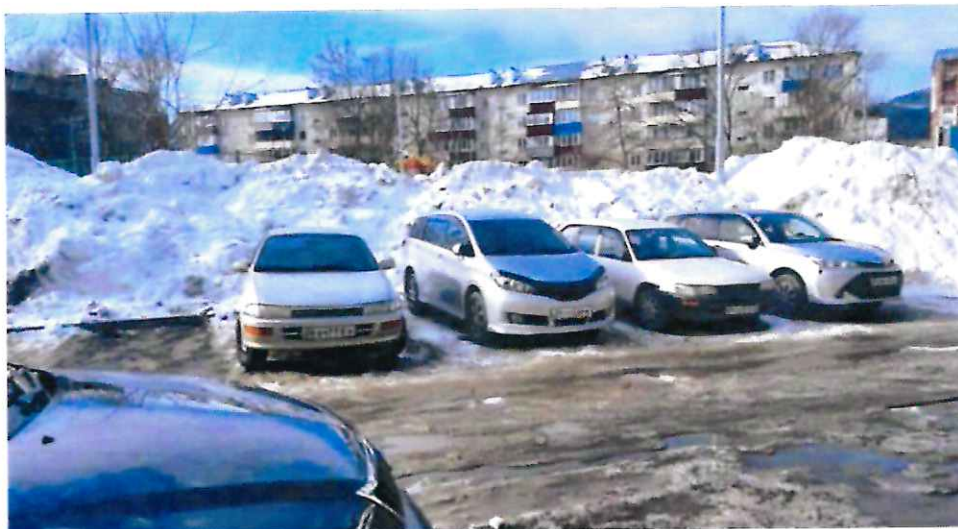
Снежные массы во дворе дома №282 по ул. Комсомольской

Я обратилась в мэрию Южно-Сахалинска с просьбой помочь в вывозе снега с этого двора и получила удивительный ответ, "разъясняющий" политику чиновников в этом вопросе. Из ответа следует, что складировать снег во дворах не запрещено, и управляющая компания самостоятельно определяет для этого подходящие места. Для своевременного вывоза снега администрация предложила включить услугу в тариф на содержание жилья (если хотите чистый двор, то платите из своего кармана. – прим. авт.), а пока - ворошите снег.