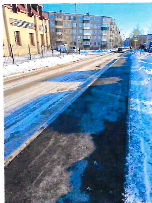
Устройство нового тротуара между общеобразовательными учреждениями ( было и стало)