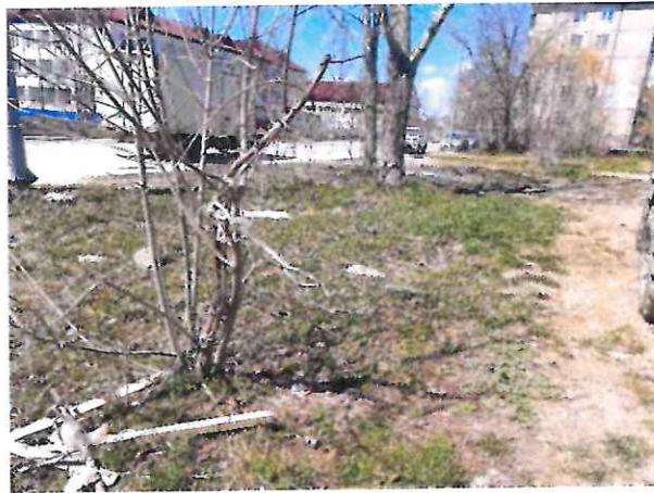
Пустырь возле детского сада №7 до благоустройства