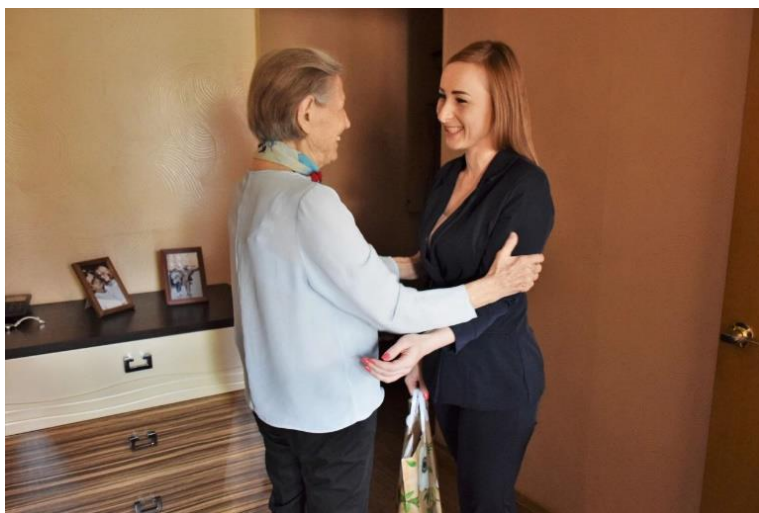
Поздравление ветеранов с годовщиной окончания Второй мировой войны