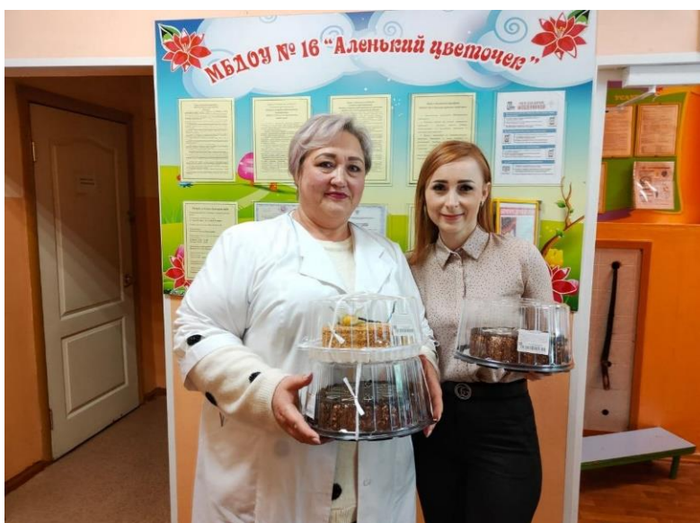
Поздравление коллективов детских садов с Днем воспитателя