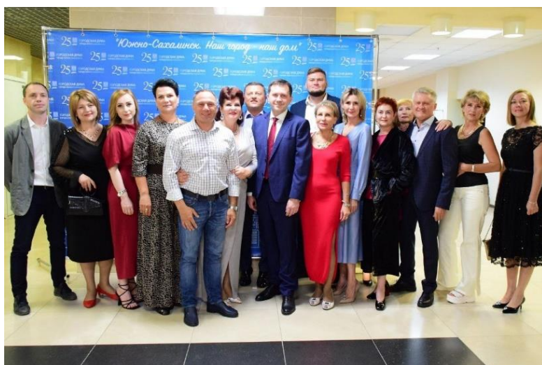
Торжественный прием, посвященный 140-летию Южно-Сахалинска и 25-летию Городской Думы