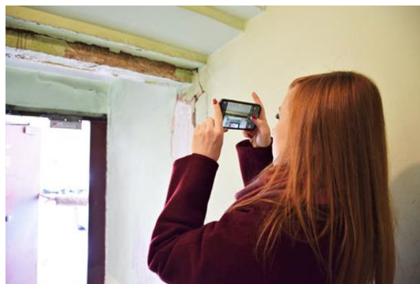
Мониторинг состояния подъездов на ул. Пушкина, 150

Недовольство качеством содержания МКД и двора в 2022-м году озвучивали мне и жители Ленина, 312 . Там горожане вообще решили отказаться от ТСЖ и перейти в УК и попросили у меня помощи в организации этого процесса. Для решения этой проблемы дважды я проводила встречу с представителями жильцов в Городской Думе, в том числе с участием специалистов мэрии. Весной 2023-го года ситуация должна разрешиться.