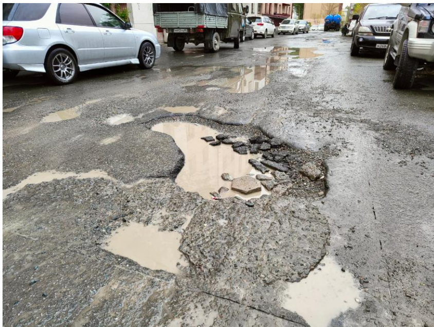
Ямочный ремонт в избирательном округе №15: в процессе и до него

Помимо жалоб на состояние дворов, на встречах жители озвучивали мне и другие проблемы. Например, возвращаясь к Пушкина, 150 и Пограничной, 55-А, отмечу претензии горожан к работе управляющих организаций. По первому адресу это, в основном, отсутствие ремонта в подъездах, по второму – целый список (уборка подъездов, работа домофона, состояние крыши и лестниц, взаимодействие УК с жильцами). По всем этим фактам я направила запросы в управляющие компании.