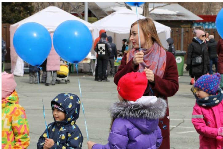
Фестиваль #ЛюдиКакЛюди, посвящённый Всемирному дню распространения информации об аутизме

В 2022м- году я старалась принимать активное участие в жизни округа и города как депутат, как член правления городского отделения «Союза женщин России», как член партии «Единая Россия» и просто как житель Южно-Сахалинска.