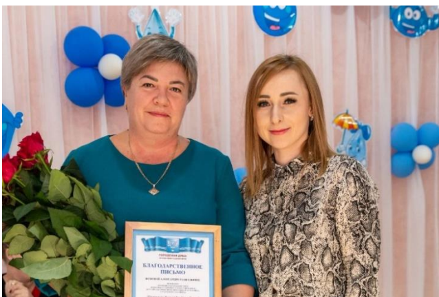
Награждение сотрудников детского сада «Росинка»