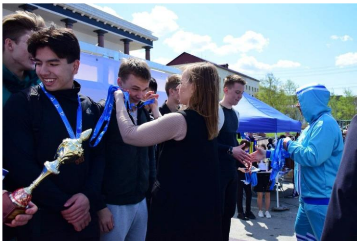
Награждение победителей легкоатлетической эстафеты на призы Городской Думы