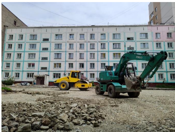
Ремонт на ул. Пушкина, 150

В 2022-м году таким двором стала придомовая территория по адресу: ул. Пушкина, 150. Чтобы максимально учесть пожелания жителей, встречи проходили на всех этапах работ – от согласования дизайн-проекта до окончания ремонта. К сожалению, из-за непростой экономической ситуации денег из бюджета на дворы стали выделять меньше, поэтому нам с жителями необходимо было выбрать, на что именно потратить средства. Решили заасфальтировать территорию, установить бордюры и дренажную систему. Помимо этого, в рамках дополнительных средств (выделяют из городского бюджета на текущие работы) на Пушкина, 150 было организовано уличное освещение.