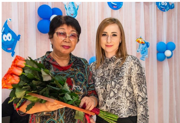
Юбилей (40 лет) детского сада «Росинка»