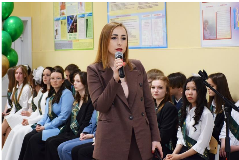
Последний звонок в школе №16 21 мая