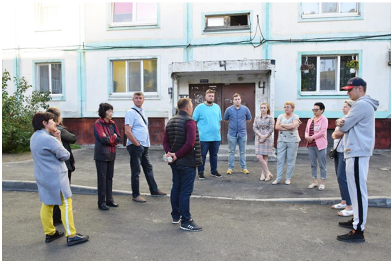
Встреча с жителями на ул. Пушкина, 150 после окончания ремонта