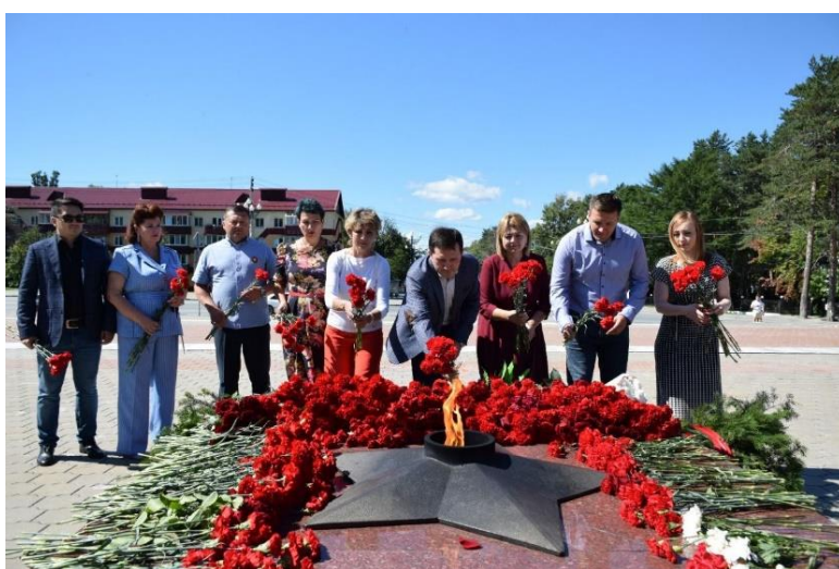
Возложение цветов к Вечному огню в честь годовщины окончания Второй мировой войны