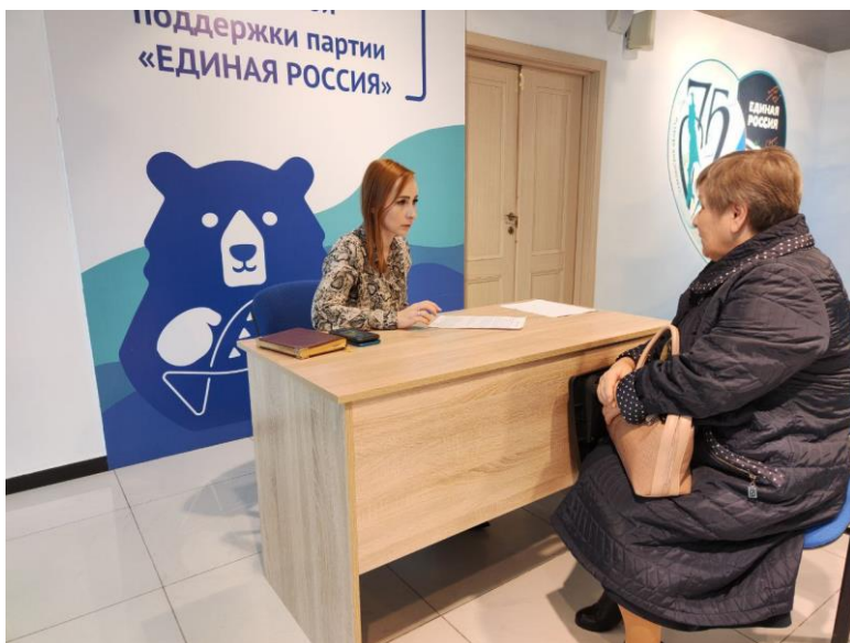
Прием граждан в штабе общественной поддержки партии «Единая Россия»