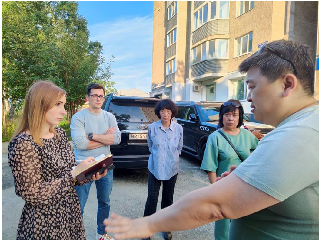
Встреча с жителями на ул. Пограничной, 55-А

Практически параллельно работы проходили и во дворе по соседству – на ул. Пограничной, 55-А . Здесь мне удалось организовать «ямочный» ремонт в формате сплошного асфальтирования, как говорится, вне очереди, за что я выражаю благодарность администрации Южно-Сахалинска. От встречи с жителями, на которой они пожаловались мне на состояние двора, до завершения всех работ прошло около двух недель. До этого здесь не было и намека на асфальт.