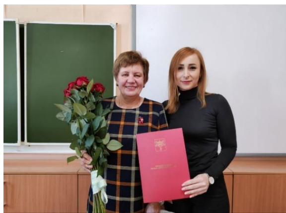
Награждение педагогов школы №16