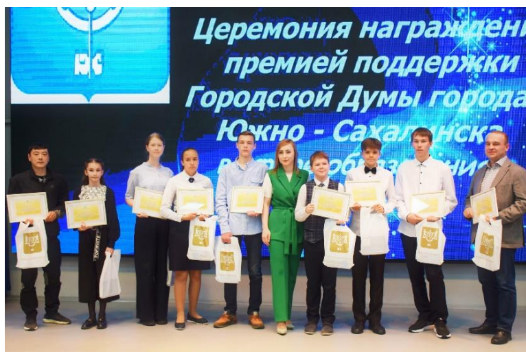
Вручение премий поддержки Городской Думы в сфере образования учащимся 5-9 классов 23 июня