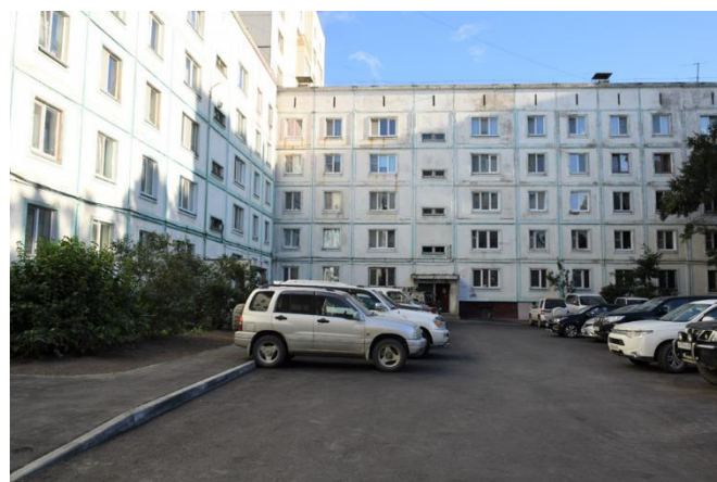
После ремонта на ул. Пушкина, 150