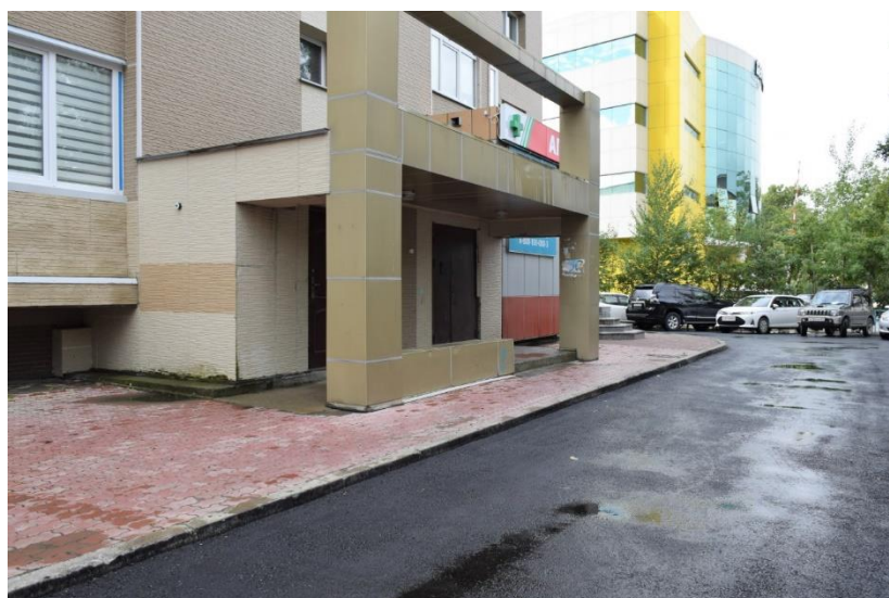
Пограничная, 55-А после ремонта

Всего же в 2022-м году ямочный ремонт прошел в 19-ти дворах избирательного округа №15. Списки составляли управляющие компании и согласовывали их со мной. По возможности, я старалась лично контролировать ход работ. Где-то было достаточно поставить несколько «заплаток», в каких-то дворах (как на Пограничной, 55-А) нужно было