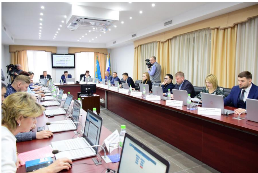
Заседание Городской Думы, утверждение бюджета на 2023-й год