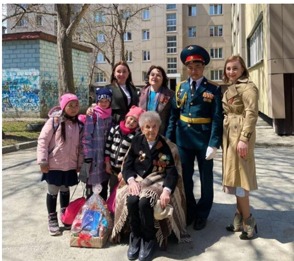
В гостях у ветеранов 15-го округа