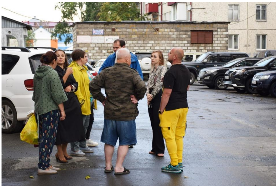
Встреча с жителями на ул. Пограничной, 61

Всего в 2022-м году я провела более десяти встреч с жителями округа – как во дворах, так и в Городской Думе. При этом отмечу, что не в моих правилах приходить к жителям ни с чем. Обычно я провожу встречи, когда есть, что сказать конкретно - например, удалось выбить внеплановый ремонт или пора обсудить с горожанами дизайн-проект. Исключением стал адрес: Пограничная, 61 , где жители сами попросили о собрании. Они высказали недовольство отсутствием капремонта фасада, подъездов и двора, состоянием детской площадки (или вернее тем, что от нее осталось). Все обращения я взяла в работу, направила запросы в соответствующие ведомства, а на самой встрече постаралась объяснить горожанам про сокращение бюджета, корректировки программ по ремонту домов/дворов, про возможность создать ТОС.