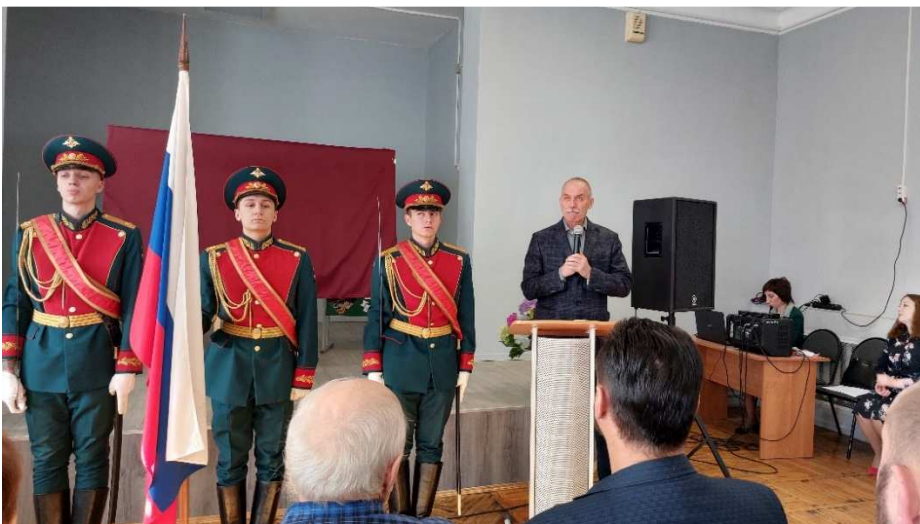
Открытие мемориального стенда в школе №23, посвященного погибшим в СВО