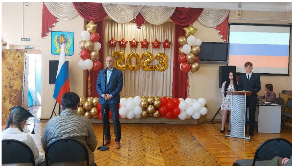
Выпускной в МБОУ СОШ № 23