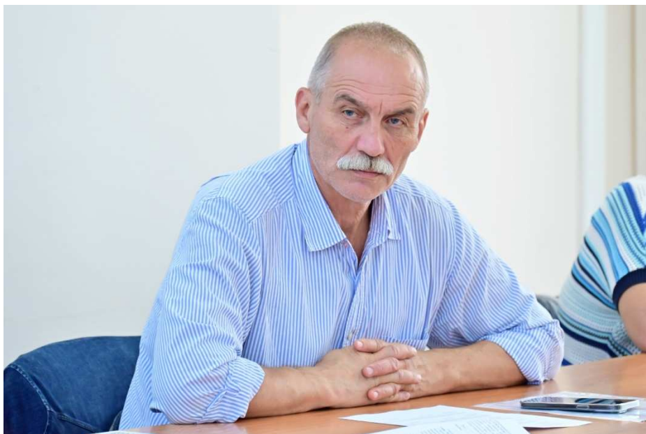
Участие в комиссии по подготовке проекта Правил землепользования и застройки (ПЗЗ) на территории городского округа