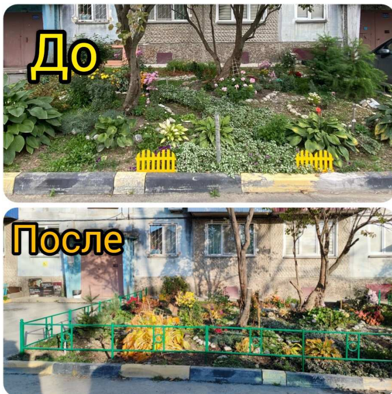
Ул. Тихоокеанская, 28, участие в гранте (установка ограждения на палисаднике)