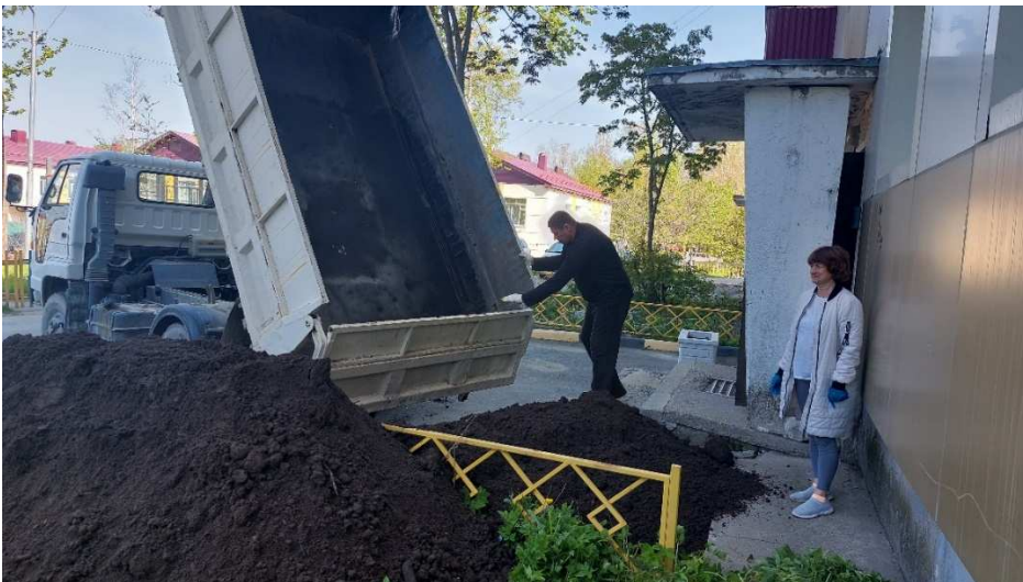
Доставка грунта жителям дома № 2 по ул. Горького