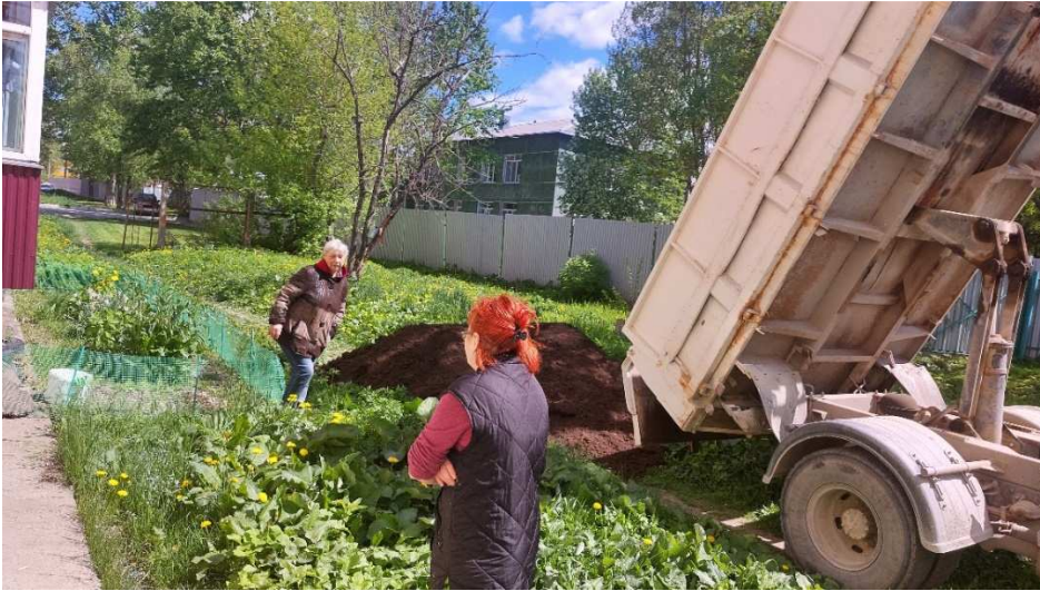
Доставка грунта жителям № 157 по ул. Комсомольская