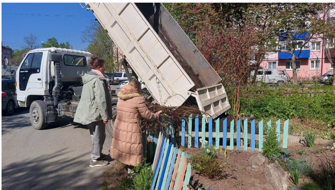
Доставка грунта жителям дома № 2 по ул. Тихоокеанская