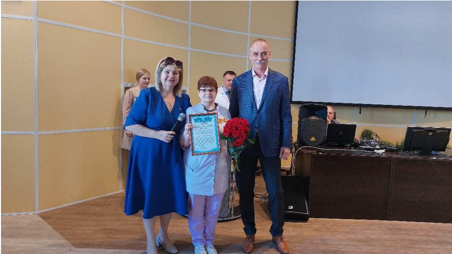
Поздравление коллектива работников городской больницы им. Ф.С. Анкудинова с Днем медика