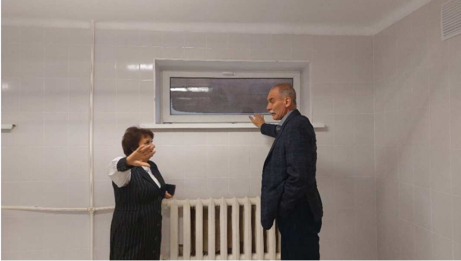
Осмотр восстановительных работ после циклона в школе № 23