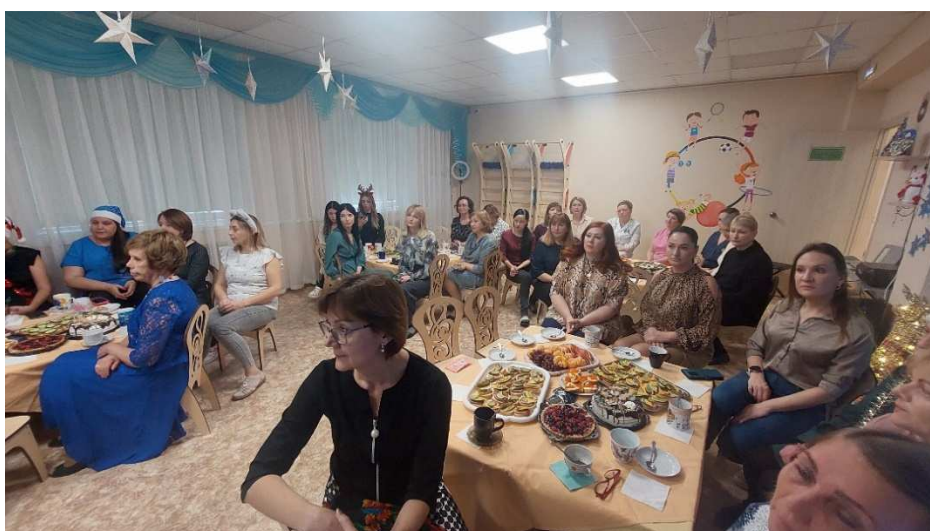
Поздравление с наступающим Новым Годом коллектива детского сада № 37 «Одуванчик»