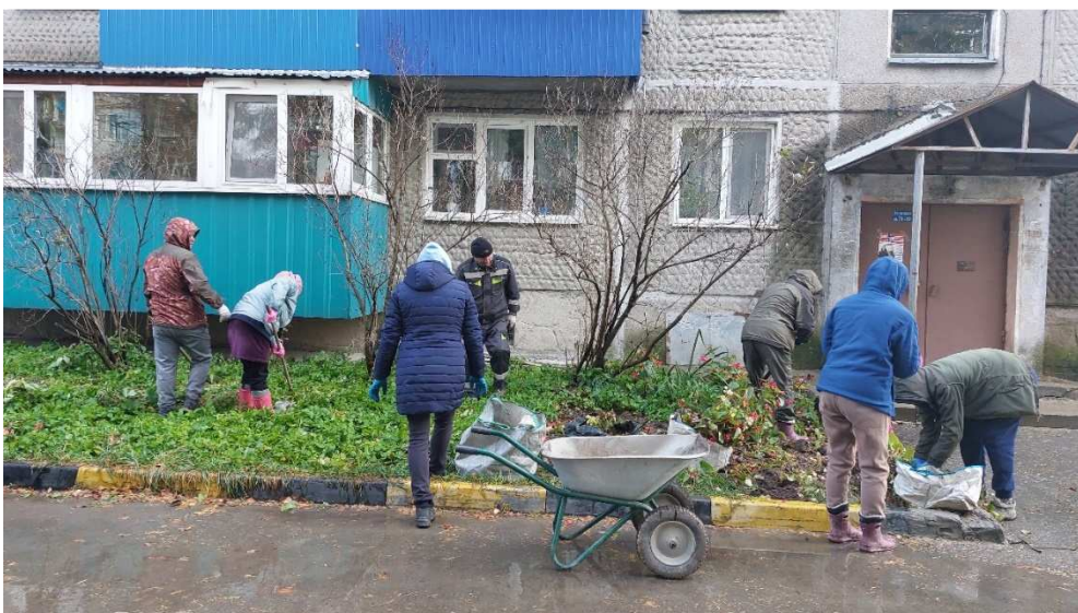
Ул. Тихоокеанская, 26, участие в гранте (высадка зеленых насаждений)