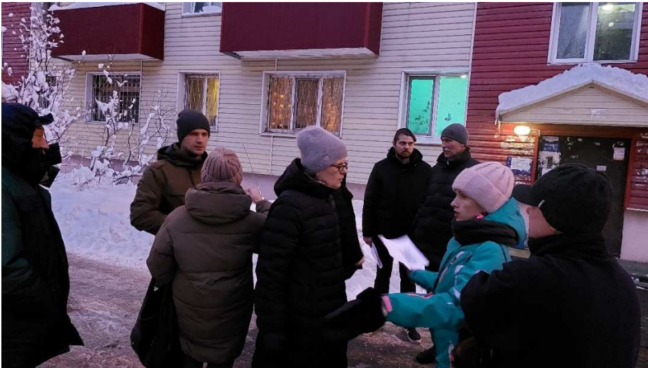
Встреча с жителями домов № 13-15 по Спортивному проезду