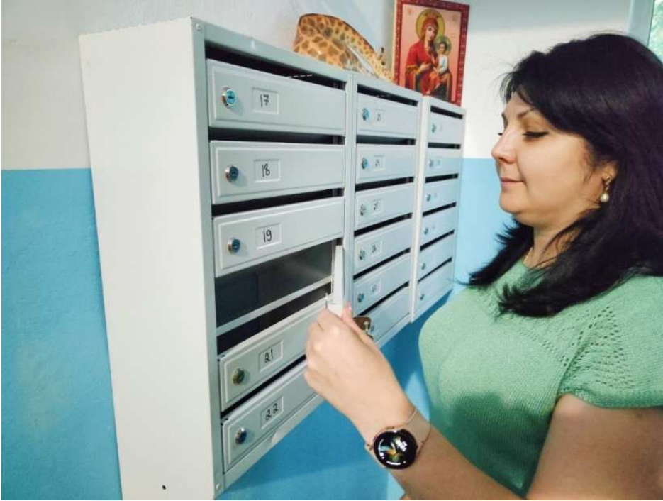
Спортивный проезд 9-А, участие в гранте (замена почтовых ящиков)