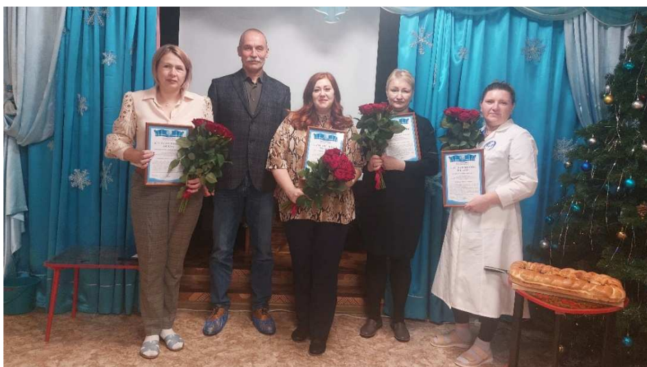
Вручение Благодарственных писем работникам детского сада № 37 «Одуванчик»