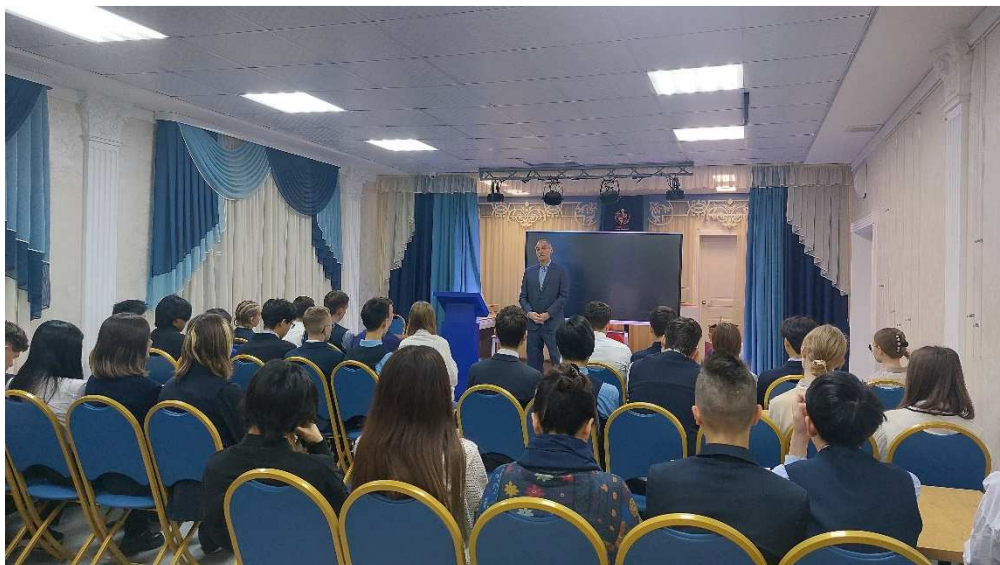
Классный час в рамках внеурочной деятельности «Разговоры о важном» в лицее № 2