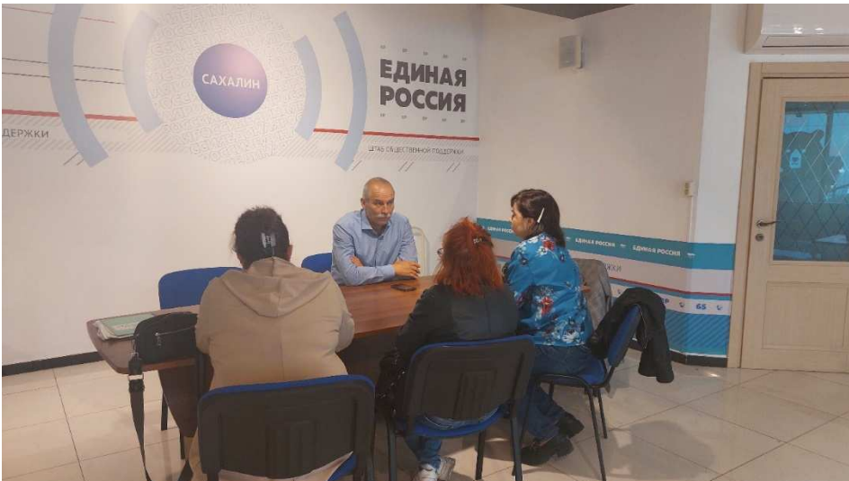
Прием граждан в общественной приемной Партии «Единая Россия»

Я еще раз хочу выразить благодарность жителям – за готовность работать сообща, за стремление вносить свой вклад в преображение нашего округа!