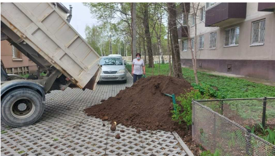
Доставка грунта жителям дома № 9 по Коммунистическому проспекту