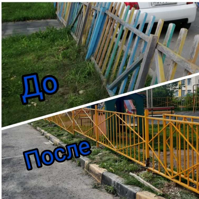
Ул. Горького, 2, участие в гранте (замена ограждения на детской площадке)