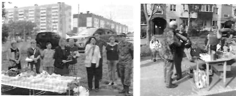
На первом и третьем фото - праздничное мероприятие, посвященное завершению реализации проекта «Комфортный и безопасный двор» ТОО Мира, д. 192а.

В августе 2022 года была полностью завершена реализация проекта «Комфортный и безопасный двор» ТОО «Мира 192а». По такому случаю был организован праздник для жителей всего округа. Были приглашены военные из воинской части №35390, которые показали мастерство и физическую подготовку. Также организована полевая кухня и проведена тренировка с препятствиями для детей. Самбисты из спортивной федерации показали мастер-класс. Детей развлекали аниматорами, проходили спортивные веселые старты. Активисты ТОО были поощрены благодарственными письмами. Такие же праздники, приуроченные к завершению реализации проектов ТОО, прошли во дворах пр. Победы, 35, ул. Комсомольская, 188, пр. Победы, 29.