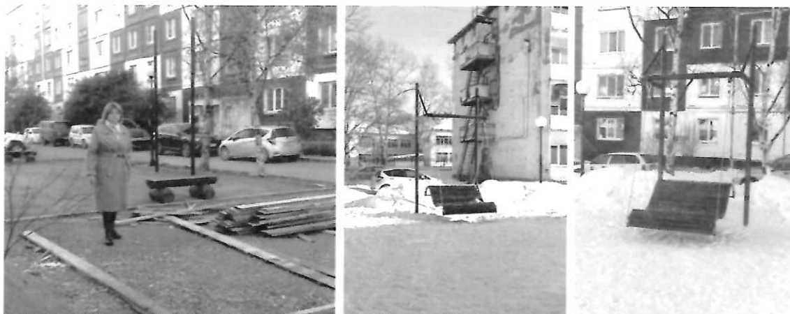
На первом фото - во дворе по пр. Победы, д. 55в работы по благоустройству. На втором и третьем фото - качели, установленные в рамках благоустройства.