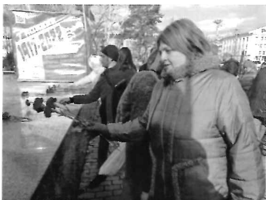
На первом фото - возложение цветов к памятнику В.И.Ленину. На втором фото – участие в праздничных мероприятиях, посвященных 9 Мая.

Приняла участие в памятных мероприятиях и возложении цветов.