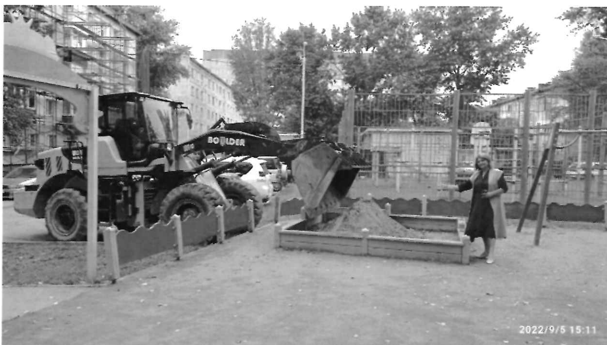
На фото - работы по заполнению песочницы во дворе домов ул. Пушкина, 131 и 118 по личной инициативе депутата

Также в рамках предвыборной кампании осуществила работу по частичному благоустройству детской площадки во дворе домов ул. Пушкина, 131 и 118, заполнила песочницу чистым морским песком. Решила вопрос по демонтажу старых и опасных бетонных опор освещения возле дома ул. Поповича, 57 и детского сада «Ласточка». В результате, благодаря администрации города и МУП «Электросервис», удалось быстро решить данную проблему.