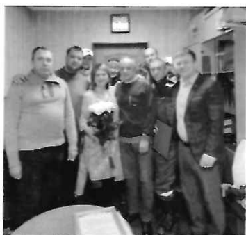
На фото - поощрение Благодарственными письмами работников МУП «Электросервис».

- поощрила Благодарственным письмом заведующего МБОУ «Ягодка» Ли Ирину и других достойных граждан города.