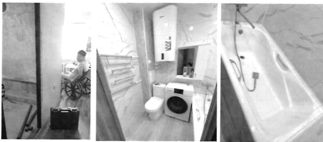
На фото - ремонт для инвалида-колясочника (в процессе и результат)

Важными также являются мероприятия, направленные на повышение уровня и качества жизни инвалидов. По данному вопросу к депутату обратилась семья инвалида-колясочника с просьбой помочь обустроить ванную комнату. По просьбе депутата специалисты департамента социальной политики оработали вопрос с инвалидом и с работниками управления капитального строительства. Благодаря личному депутатскому контролю и добросовестному подрядчику в лице предпринимателя Ким И.А. был сделан ремонт с заменой всех коммуникаций, установкой счетчиков для воды и т.д., кроме того, был дополнительно установлен еще и титан. Таким образом, совместными усилиями создана комфортная среда проживания для инвалида-колясочника.