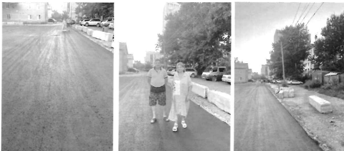
На фото - проверка результатов асфальтирования парковки за домом по пр. Мира, 192а.

В августе 2022 года была полностью завершена реализация проекта «Комфортный и безопасный двор» ТОО «Мира 192а». По такому случаю был организован праздник для жителей всего округа. Были приглашены военные из воинской части №35390, которые показали мастерство и физическую подготовку. Также организована полевая кухня и проведена тренировка с препятствиями для детей. Самбисты из спортивной федерации показали мастер-класс. Детей развлекали аниматорами, проходили спортивные веселые старты. Активисты ТОО были поощрены благодарственными письмами. Такие же праздники, приуроченные к завершению реализации проектов ТОО, прошли во дворах пр. Победы, 35, ул. Комсомольская, 188, пр. Победы, 29.