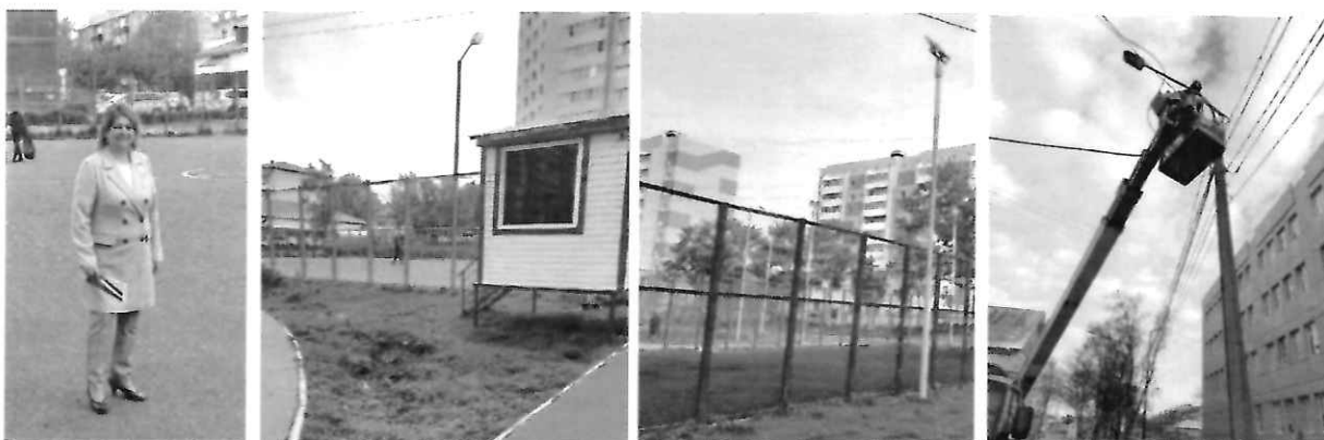
На фото – депутатская инспекция работ, проведенных на стадионе школы №3 (домик с охраной, забор, освещение). На четвертом фото - техобслуживание электрических столбов возле школы №3 специалистами МУП «Электросервис»

Были проведены работы по капитальному ремонту многоквартирных домов по адресу: ул. Пограничная, 20 и 22. Депутат держала на контроле ситуацию и способствовала скорейшему разрешению вопросов, касающихся капитальных работ по замене внутренних инженерных и электрических сетей. Также по желанию жителей ул.