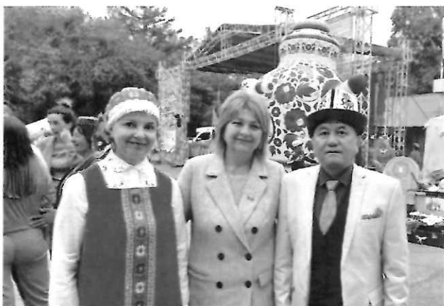
На фото - с участниками областного Сахалинского Сабантуя- 2022