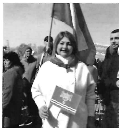
На фото - участие в мероприятии, посвященном Дню весны и труда.