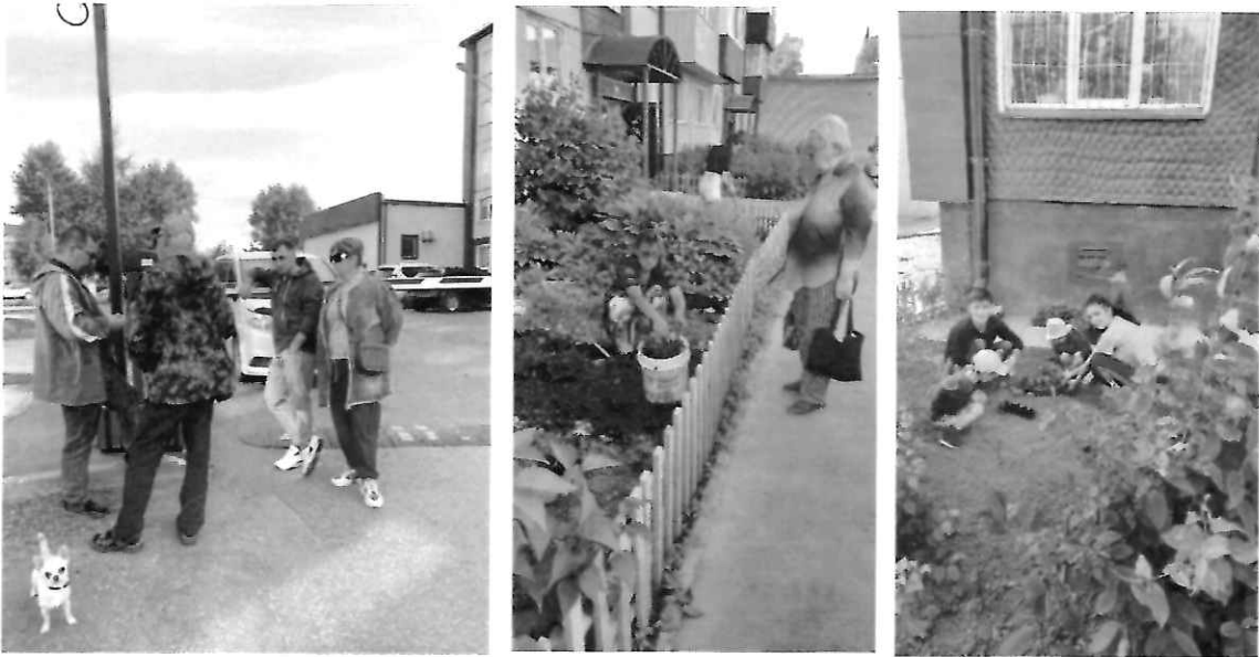
На первом фото - установка мусорного бака во дворе дома пр. Победы, 35. На втором и третьем фото - жители пр. Победы, д. 35 высаживают цветы, закупленные в рамках гранта.