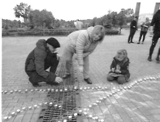
На фото – участие в акции «Огненные картины войны», посвященной 81-й годовщине со дня начала Великой Отечественной войны

Приняла участие в памятных мероприятиях и возложении цветов.