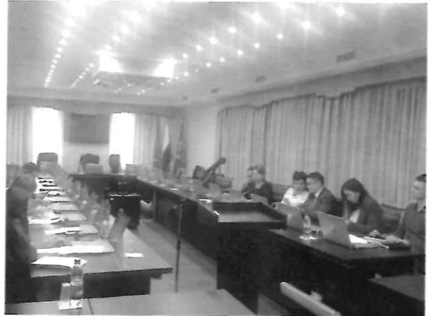
На первом фото - установленный памятник Ощепкову В.С. На втором фото – депутаты Городской Думы и специалисты администрации на заседании оргкомитета по вопросу создания сквера памяти Ощепкову В.С.