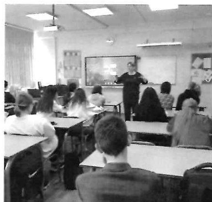
На фото - на уроке обществознания депутат читает лекцию на тему «Избирательное право» в школе МБОУ СОШ №3.