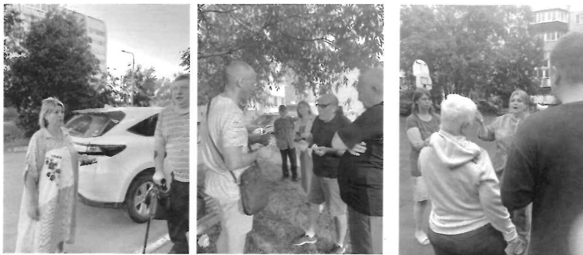
На фотографиях - встречи с жителями округа в качестве кандидата в депутаты Сахалинской областной думы восьмого созыва