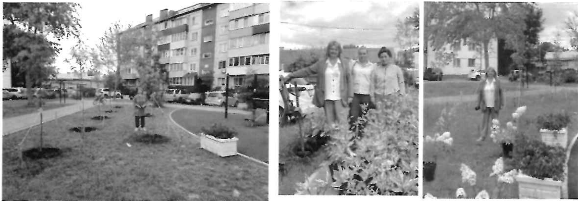
На фото - работы по озеленению двора ул. Комсомольская, д. 188.

По многочисленным обращениям жителей депутатом была инициирована встреча по благоустройству муниципального земельного участка, граничащего с домами на пр. Мира, 192, 192а и на ул. Пограничная, 36. Специалисты администрации презентовали активистам этих домов эскиз для дальнейшего обсуждения с жителями. Ввиду отсутствия финансирования было принято решение о сплошном асфальтировании, согласованного с жителями. Были проведены работы по созданию большой парковки за домом пр. Мира, 192А бригадой МКП «ЗСМ им. М.А.Федотова». Кроме того, по обращению жителей дома, которые попросили ускорить вывоз старых гаражей, депутат взяла на контроль эту проблему, которую планируется разрешить в 2023 году.