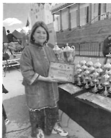
На первом и втором фото - вручение призов победителям эстафеты на Кубок Городской Думы Южно-Сахалинска.

В 2022 году вручила 5 Почетных грамот и 11 Благодарственных писем Городской Думы города Южно-Сахалинска: