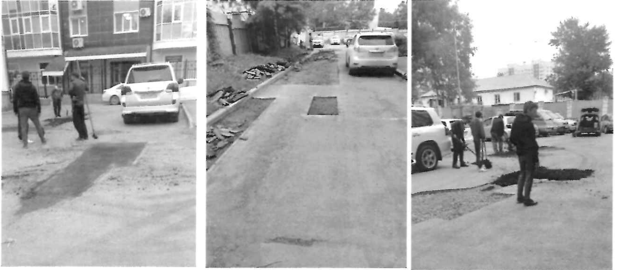
На фотографиях - работы по ямочному ремонту асфальтных покрытий дворовых дорог во дворах пр. Победы, д. 61 и д. 65а.