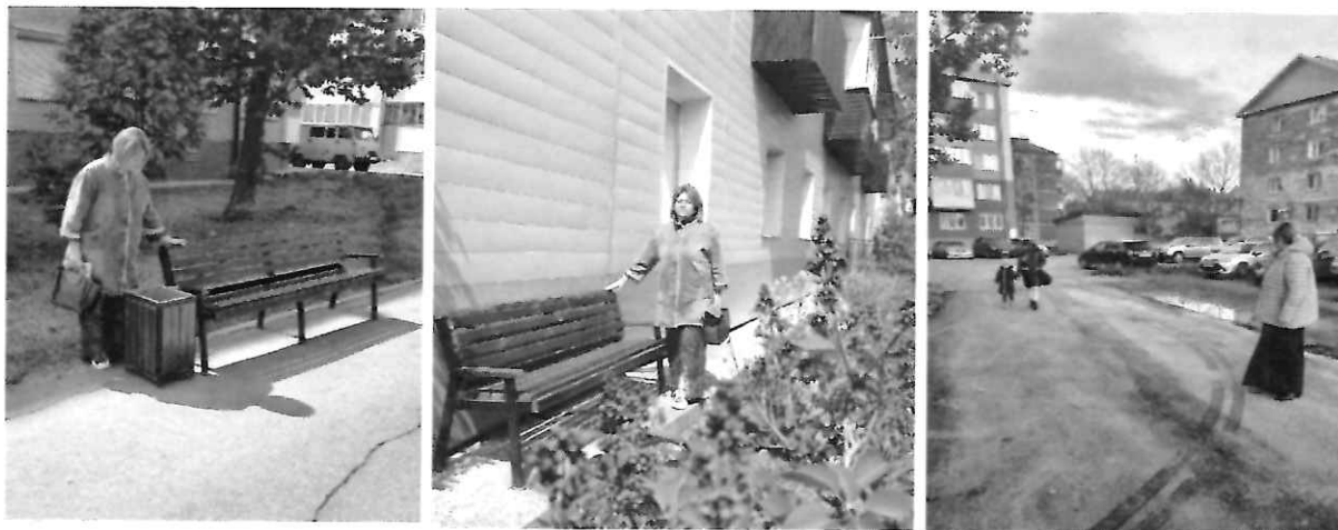
На первом и втором фото - установленные для ветеранов лавочки. На третьем фото - выполненные работы по асфальтированию двора по пр. Победы, д. 61 и дороги к нему.

Три года жители дома, проживающие по пр. Победы, 61а, обращались в адрес депутата с просьбой заасфальтировать маленький двор. В 2022 году администрацией города был положен асфальт не только возле дома, но и на дороге, которая ведёт к нему.