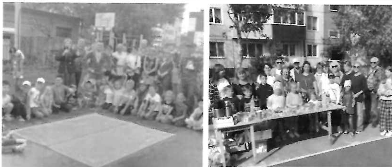
На четвертом фото — праздник, посвященный завершению проектов озеленению двора ул. Комсомольская, д. 188, пр. Победы, д. 35.

По просьбе почетных жителей города были установлены дополнительные лавочки: на пешеходной дорожке на пр. Мира, ведущей к магазину «Первый Семейный», под