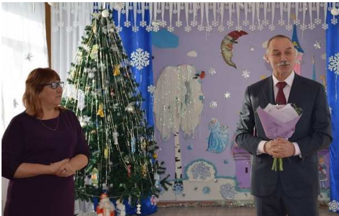
Новогодние поздравления сотрудников детского сада № 42 «Черемушки», ДЕКАБРЬ 2019г.