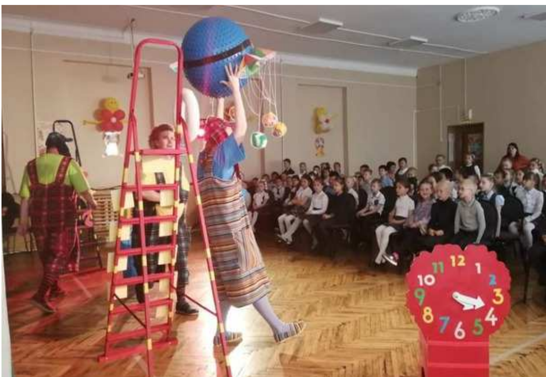
Выездной спектакль для первоклассников школы № 23 в связи с окончанием учебного года, МАЙ 2019г.