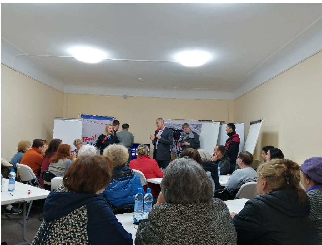
Стратегическая сессия с жителями по вопросам дальнейшего развития микрорайона Черемушки, ИЮНЬ 2019г.