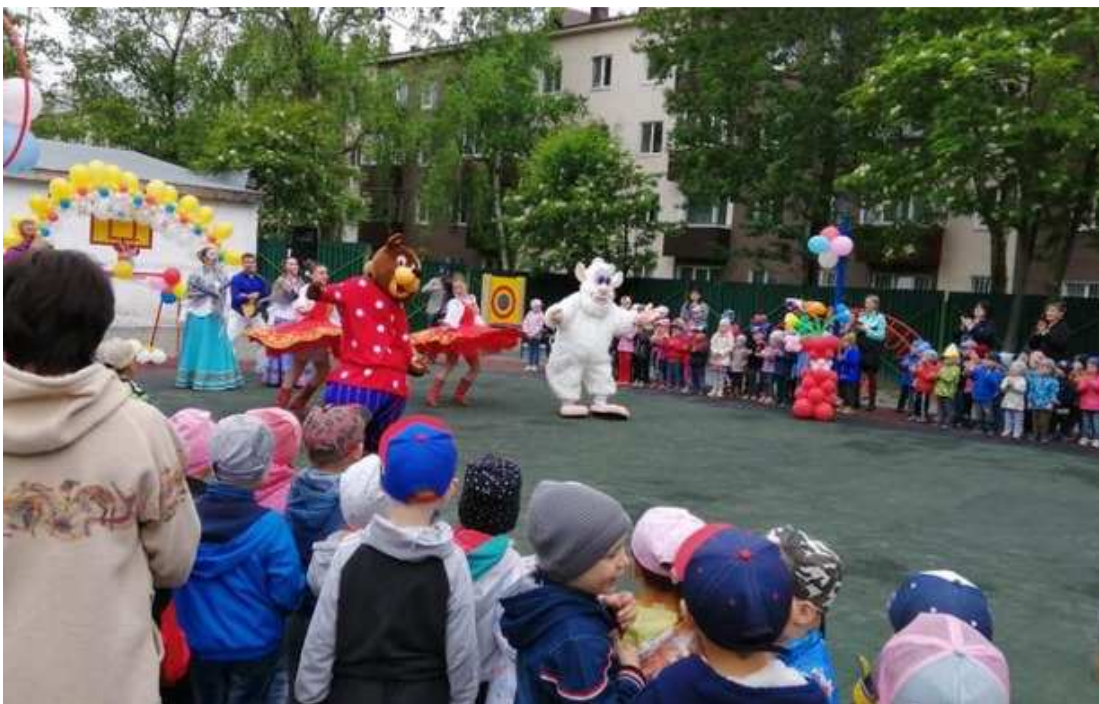
Детский сад «Черемушки»: помощь в проведении и организации праздника ко Дню защиты детей. ИЮНЬ 2019г.