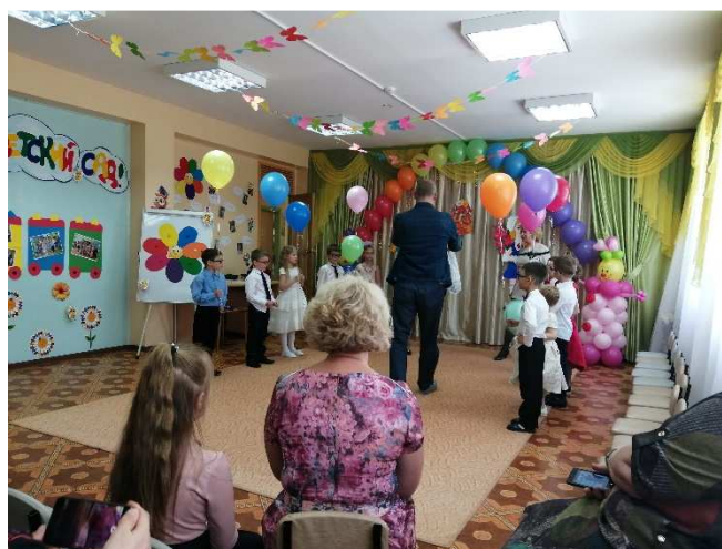
Вручение грамот сотрудникам детского сада компенсирующего вида, поздравления воспитанников специализированного дошкольного образовательного учреждения для детей с нарушением зрения, ИЮЛЬ 2019г