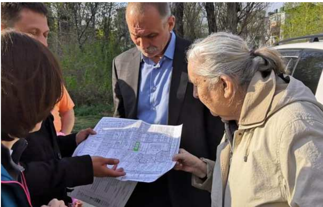
Встреча с жителями по Спортивному проезду, ИЮНЬ 2019г.